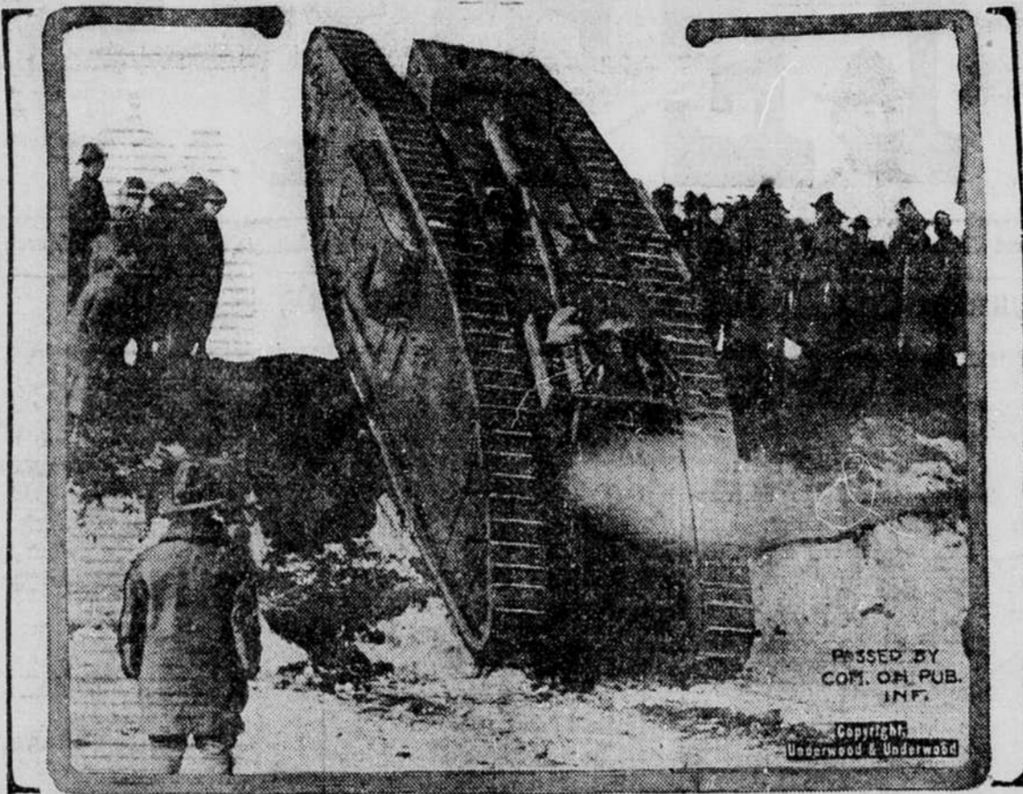
Geras pavyzdys angly garsa us "kubilo" (tank), kuris eina skersai tranšėjams, duobes, per sienas ir namus — viską po kelyj lauždamas. Kareiviai yra paslėpti "kubilo" viduryj.