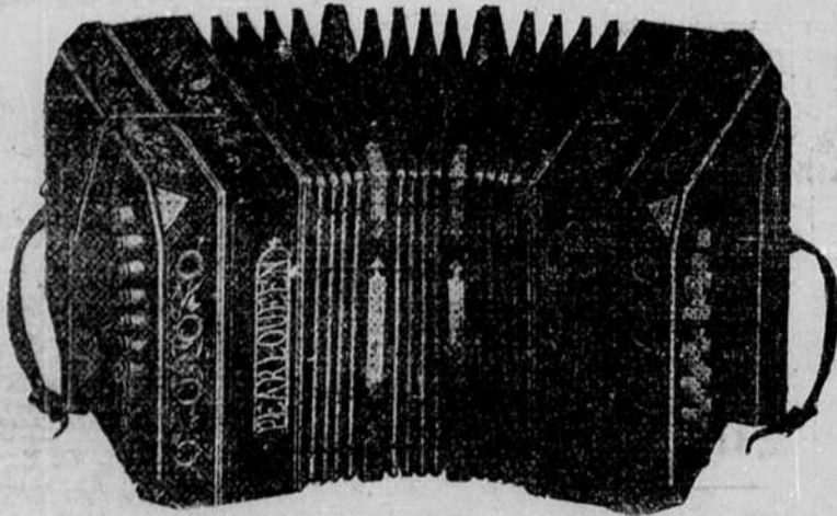
PEARL QUEEN CONCERTINOS

Puikiausias ir geriausias muzikališkas instrumentas, kokio dar nesiranda tarpe lietuvių. Šios koncertinos yra geriausios išdirbystės. Taipgi pripažintos tarptautiniu instrumentu. Galima jomis gražiai orchesterje ir viena. Beto mūsų Diežiausioj Krautuvėj yra visokių muzikališkų instrumentų, laikrodžių, žiedų, drukuojamų mašinų, deimantų; kokių tik žmogus reikalauja savo pagražinimui ir madaui. Kataliogą siunčiame dykai tiems, kurie prisijūs už 3c. krasos ženklelį.