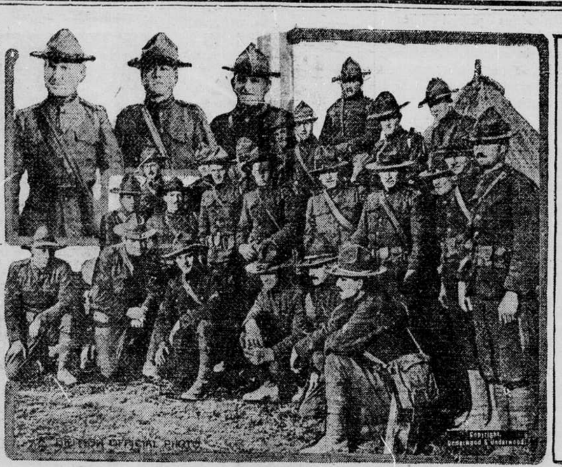
PIRMI AMERIKONAI MUŠYJE.

Sie Amerikos kareiviai priklauso prie inžinierių korpuso ir jiems teko dalyvauti mušy-