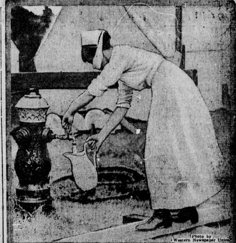
INFLUENZA YRA UŽKRECIAMA. „Nursės,“ gydancios ligonius, susirgusius influenza, laiko burną užrištą, kad neužsikrėsti, kaip šitas paveikslėlis parodo.

Tokių paskalų tikslas aiškus: atbaidyti vyrus nuo kariūmenės, nupuldyti juos dvasioje, o tē- vams ir giminėms, kurie turi