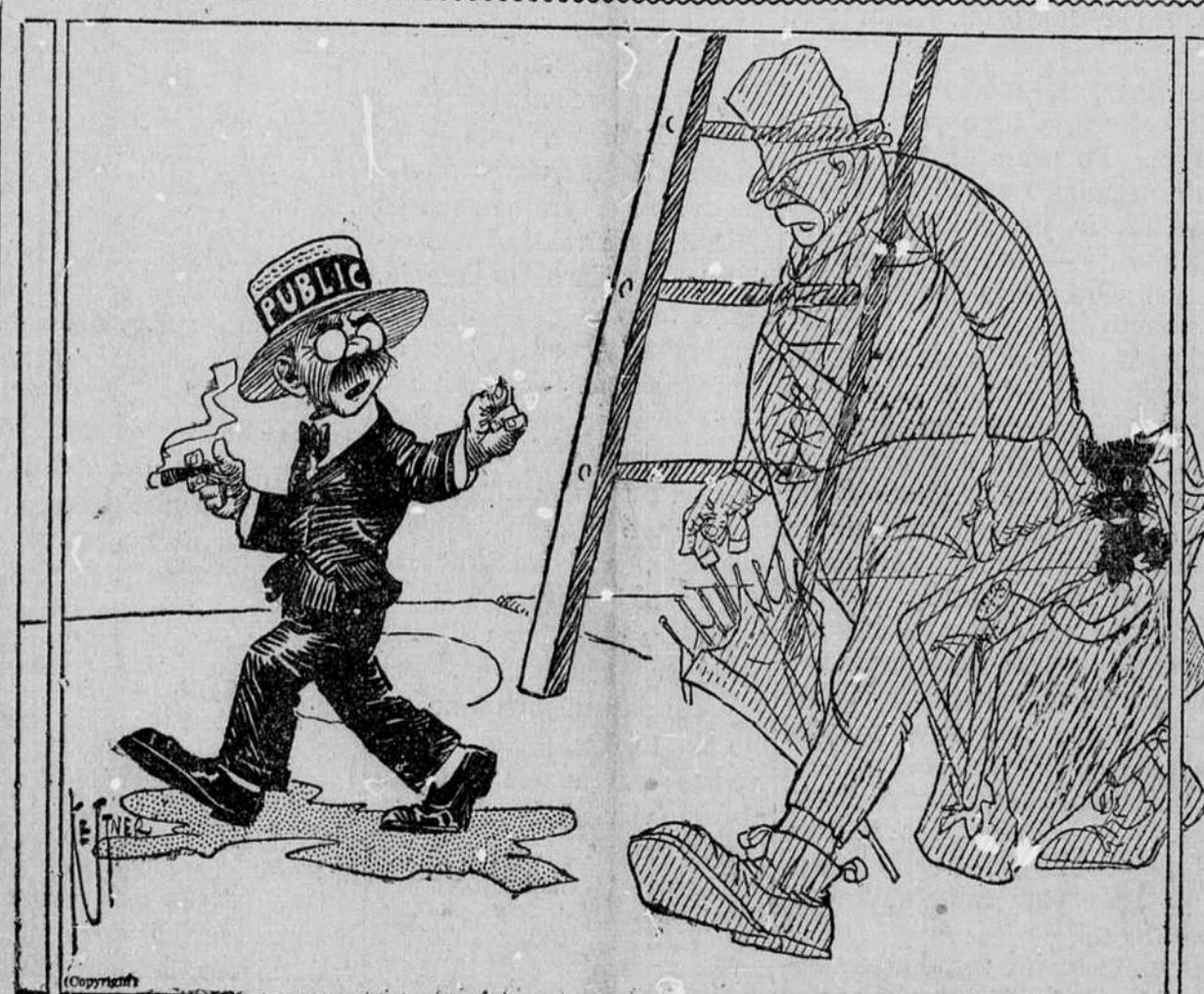
Klerikalų Mašina mėgino nubaidyti Visuomenę (Publiką) nuo Seimo, bet Visuomenė, graži, Seimą atlaikiusi, nei nepaiso šmėklos.