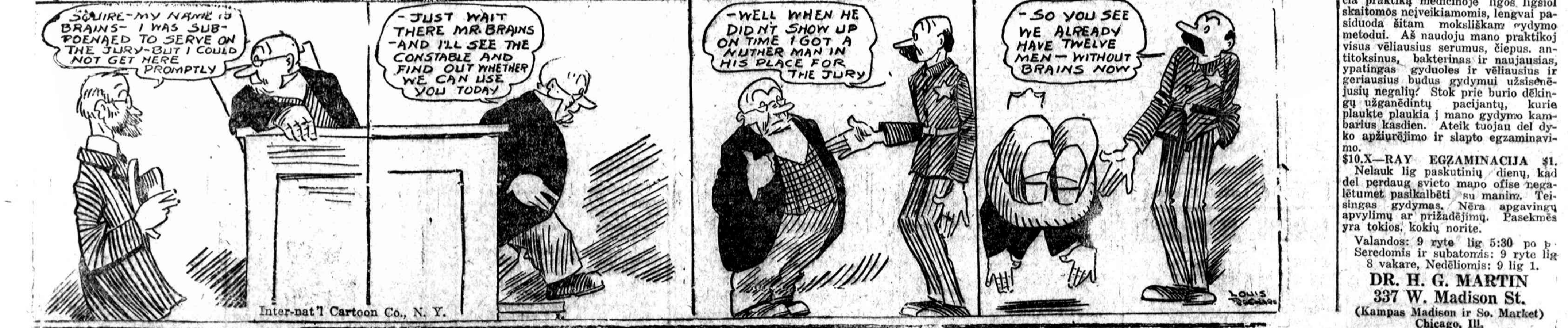
Inter-nat'l Cartoon Co., N. Y.