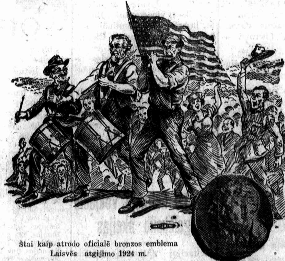
Štai kaip atrodo oficialė bronzos emblemą Laisvės atgijimo 1924 m.

Dabar yra proga, kur kiekvienas asmuo gali prisidėti prie pagerinimo šios šalies gyvenimo sąlygų išrenkant tokią valdžią, kuri rūpinutisi gerove daugumos žmonių, darbo žmonių ir viso krašto. Stokime į darbą tuojaus! Aukokime savo dalį — dolerį ir už tą auką įsigykime emblemą Laisvosios Dvasios sau ir savo šeimynoms nariams, ir raginkime prie to kitus! Jusų parama yra reikalinga tuojaus!