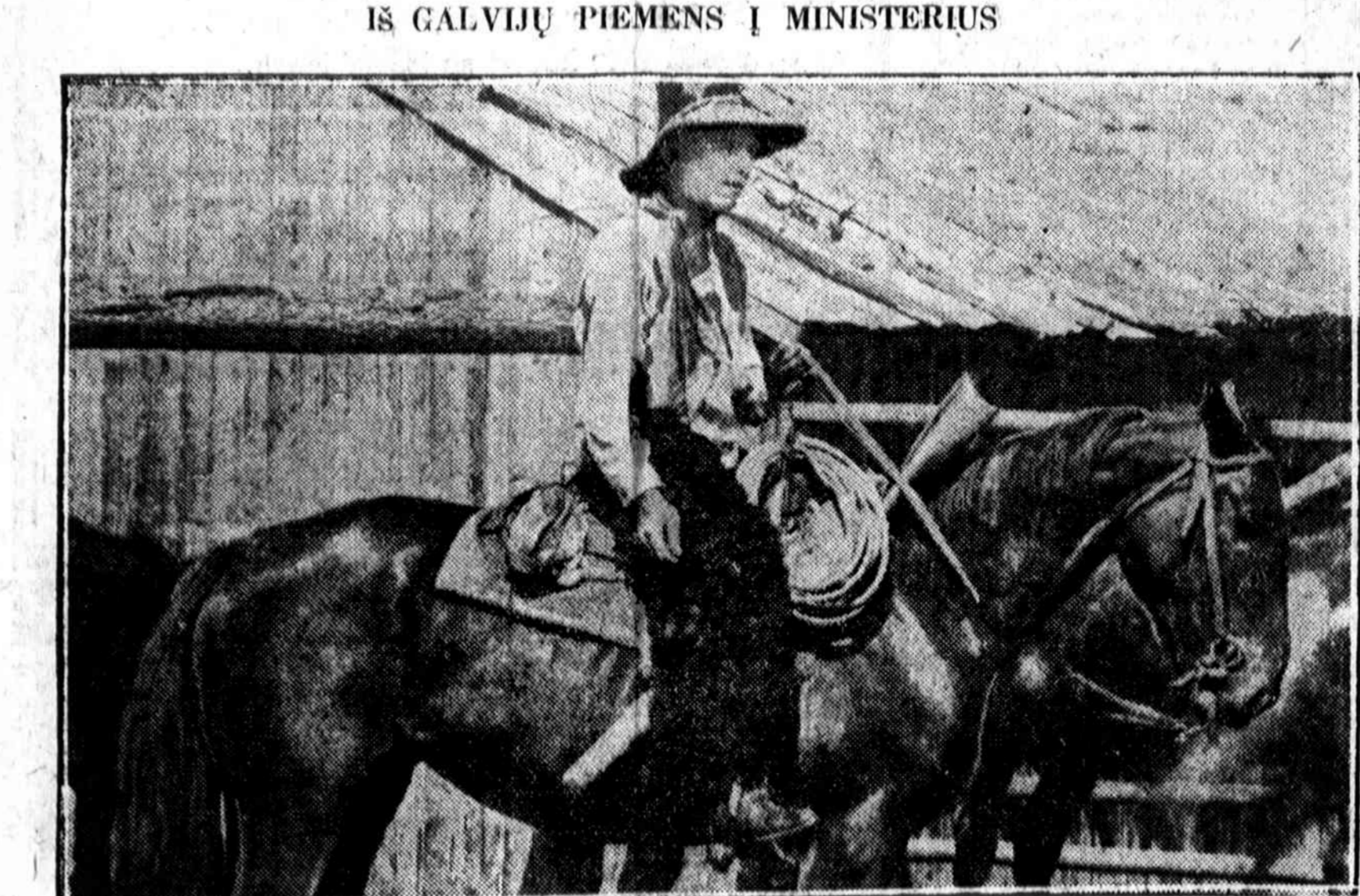
Sis raitas "kauboi" tai William M. Jardine, naujasis agrikultūros sekretorius (ministris) Prezidento Coolidge'o kabinete. Prieš kiek metų Jardine buvo "kauboi" — ganė didelės galvijų kaimenes Montanos prerijose.

TOPEKA, Kas., kovo 12. — Kansas valstijos legislatura priėmė įstatymą, kuriuo užginama japonams turėti nuosavybę, pirkti, arba dagi nuomoti žemę Kansas valstijoj. Įstatymas pasisūsta gubernatoriui pasirašyti.