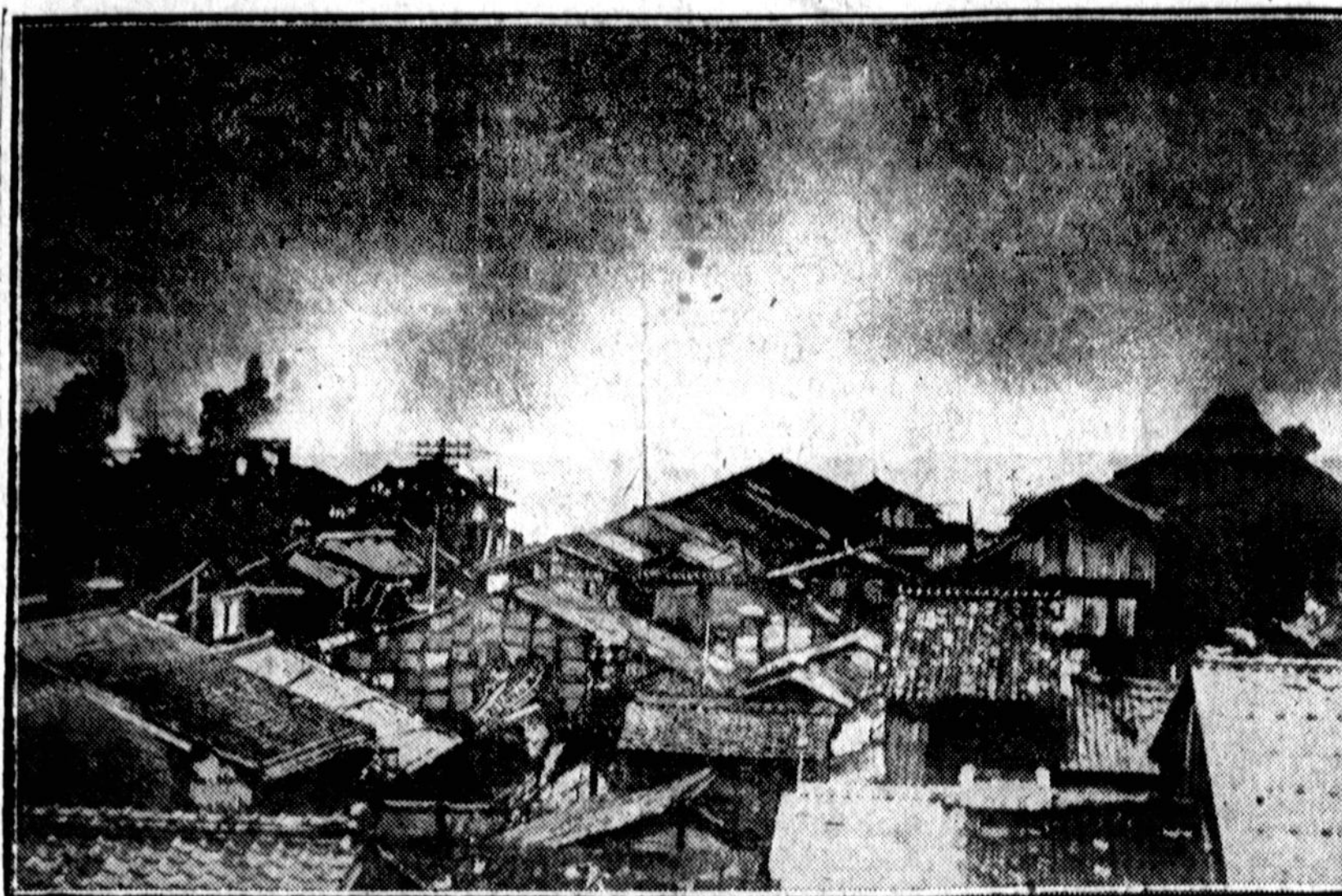
Paveikslėlis parodo degantį Japonijos miestelį Kinosakį, įvykus ten neseniai smarkiame žemės drebėjimui. Keturi šimtai žmonių buvo užmušta ir daugiau kaip trys šimtai sužeista. Miestelis Kinosaki, garsus savo karštais šaltiniais, į kuriuos žmonės iš visur važiuodavo maudytis, buvo visai gaisro sunaikintas, o karštas šaltinių vanduo po žemės drebėjimo pasidarė šaltas.