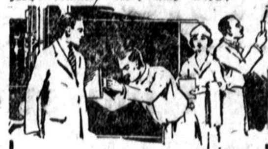
"Jaučiasi Kaip Naujas Žmogus"

Ligos teisingai suprastos yra pusiau išgydytos. Jūs jus kenčiate, atsižvelkite daug au kenčiate nuo pažadų ir "apeliuotų" daktarų. Atėikite į HOUSE OF HEALTH del pilno Pieno ir Laboratorijos Egzaminavimo, čia atkelsime jūsų sveikatą stovl kaip knyga.