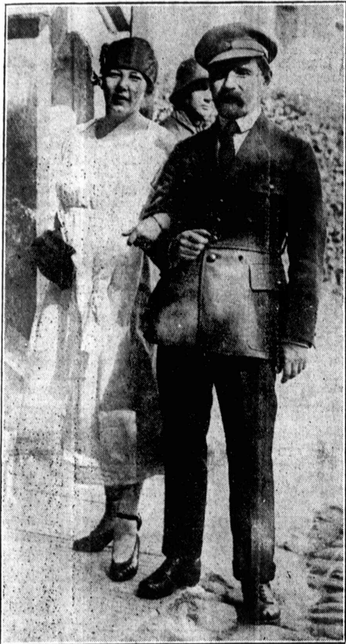
ANTANAS SMETONA—PONIA SMETONIENE