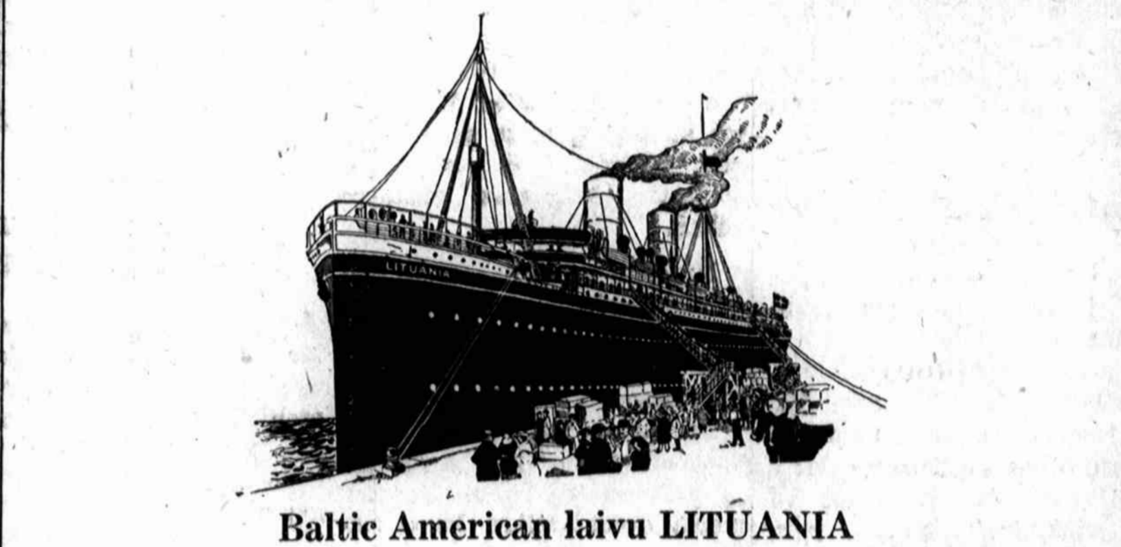
Baltic American laivu LITUANIA

Ši ekskursija pasižymės nepaprastomis ypatybėmis: 1. Ji plauks iš New Yorko Klaipėdon be persėdimo, 2. Duos geriausių patarnavimą, valgi, refrešmentus ir užlaikymą, 3. Specialė atida lietuviams; lietuviški šokiai ir muzika, 4. Puikiausi vaizdai plaukiant Baltiko jurėmis.