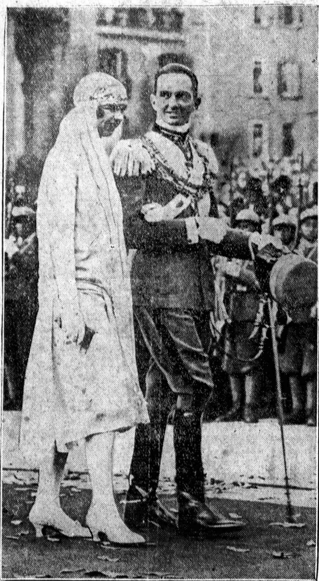
Princas Humbert, Italijos sosto įpėdinis, ir jo žmona, Belgijos karaliaus duktė. Juodu apšvedė sausio 8 d.