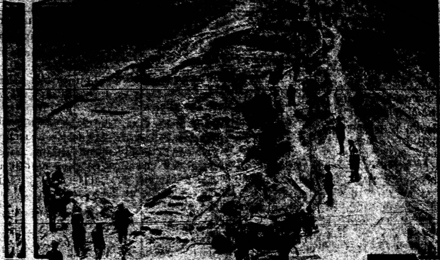
Abelinas vaizdas Scolfield užtvankos netoli Salt Lake City, parodo kaip gelbėjimo darbininkai taiso užtvankos plyšius. Gyventojai buvo labai išgąsdinti ir daugelis išsikraustė i saugesnes vietas. Bet dabar pavojaus nėra ir gyventojai pabėgusieji sugrįžo ir sau ramiai darbuojasi.