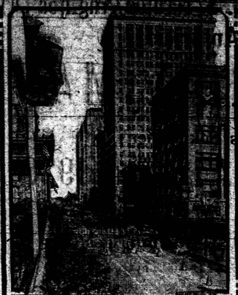
Vaidas Texas Avenue, Houstone, laike Demokratų konvencijos, parodo plevėsujančias vėliavas nuo namų ir minia žmonių.

5 kambariai "Darbininko" namo su šiluma ir labai pigiai. Del informacijų kreiptis "Darbininko" Administracija.