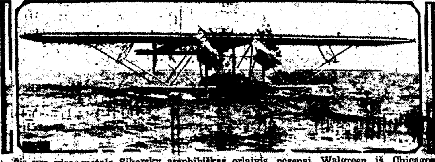
Šis yra visas-metalo Sikorsky amfibijinis orlaivis, pėsenai Walgreen iš Chicago nupirktas ir jam pristatytas.

Kitoms ligoms betarpiai užsikrėtus šiltinių bakteri-