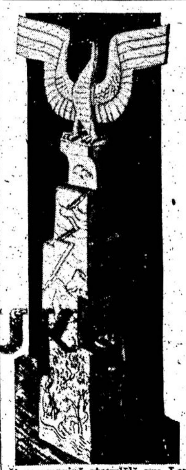
Ši marmorinė stovylė yra Lenkijos paskirta dovana lakūnui, kurs laimės skridimą į aukštąjį Clevelande, lakūnų lenktynėse.

CAMBRIDGE, ILL. — Šios apylinkės išdminikas pranešė, jog jis parduoda 15 mylių ilgumo geležinkelį.