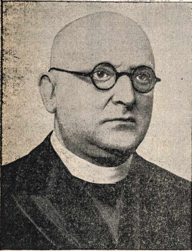
Ministras Pirmininkas Vladas Mironas

1936 m. gruodžio 5 d. paskirtas Užsienių Reikalų Ministerijos generaliniu sekretoriumi.