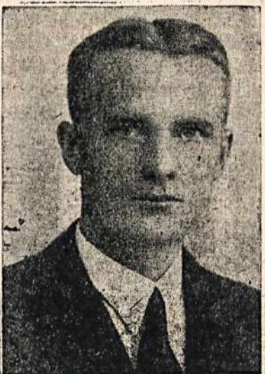
Žemės ūkio ministras Juozas Skaisgiris