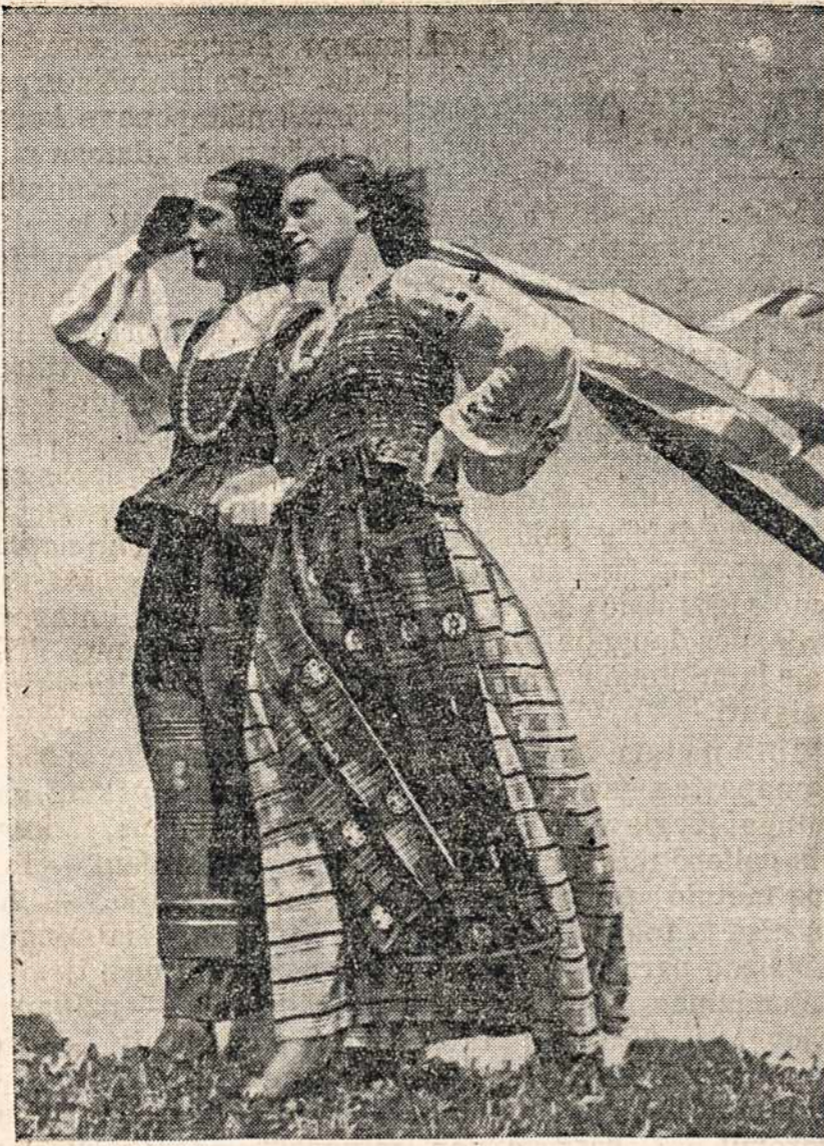
MŪSŲ LIETUVA. Lietuvaitės, tautiniais rūbais, žydinčioje lankoje gaivinančio vėjo glostomos. VDV

Taigi primename ir LDS kuopoms, kad didžiumoje LDS narių duoklės baigiasi Gruodžio mėnesį. Taigi prašytume visų gerb. LDS narių laiku apsimokėti už organą "Darbininką".