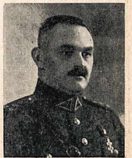
Vidaus reikalų ministras Silvestras Leonas

ALRK Moterų Sąjungos 59 kp. jubiliejinis bankietas įvyks sausio 8, 1939. Tikietai pasiduoda iš anksto. Bankieto vakare nebus parduodami. Enė.