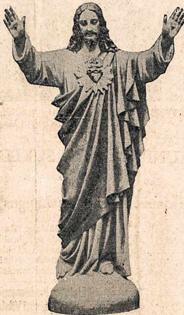
"Aš esu tiesa, kelias ir gyvenimas".

Kaip ir kada Vokietijos diktatorius ir jo karinis štabas pradės įrodyti darbais Anglijai, kol kas nėra žinoma. Bet kol kas nežiūrime, kad Hitleris pradėtų naują ofensyvą vakaruose. Tačiau, vakar Hitleris turėjo konferenciją su savo karo vadais. Ką jie ten nutarė viešai neskelbia.