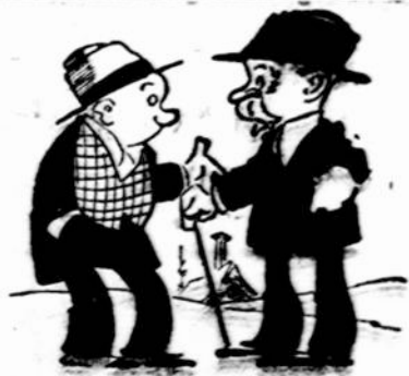
KAS — KUR?