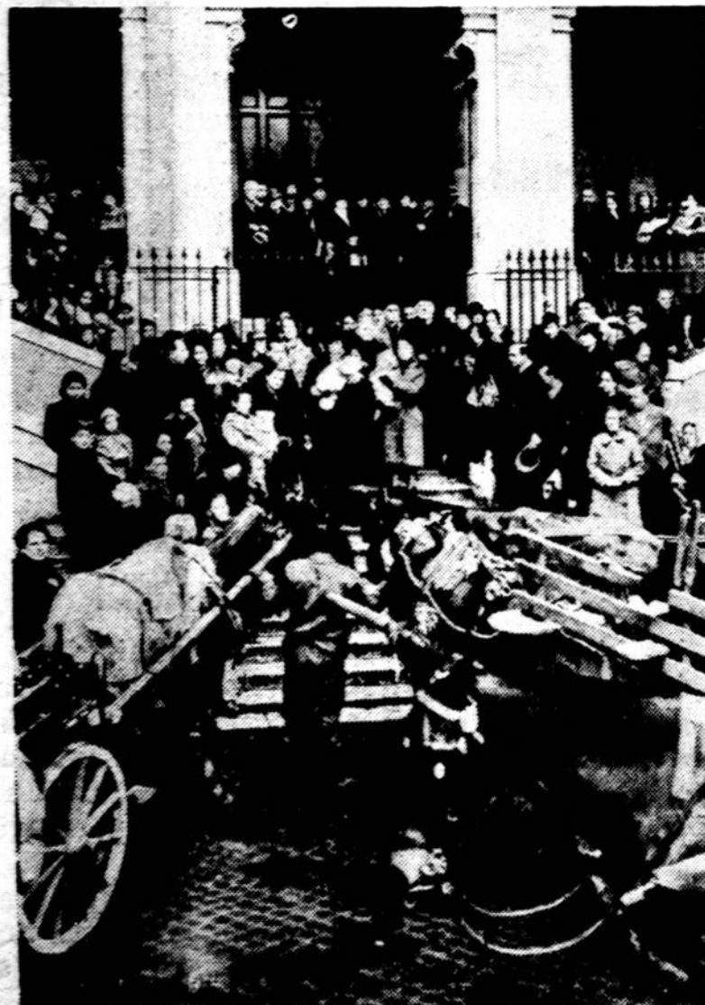
Čia parodo tradicijines apeigas Romoje, Italijoje, kur Sv. Antano šventėje, patrono paukščių ir galvijų, prie Sv. Antano par. bažnyčios laiminami galvijai.

Airijos Respublikonų armijos simpatizatoriai norėjo padaryti susirinkimą Belfasto apylinkėje. Iš vakaro kraštutiniai respublikonų armijos nariai pa-