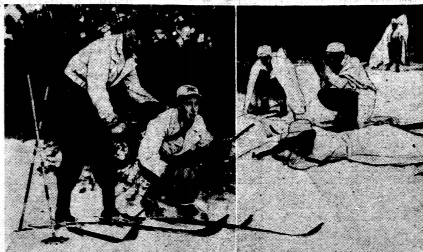
Suomiai parodė pasau liui, kad pašliužos yra nau dingos ne tik žieminiams sportui, bet ir karėje. Štai mokintis vartoti pašliužas ir Jung. Valstybių karo vadovybė įsakė jaunuoliams

Girtuokliavimas, kūniškoji meilė, pavydas ir velnias — visi lygūs tarp savęs. Ką jie užvaldo, to prąta pražudo.