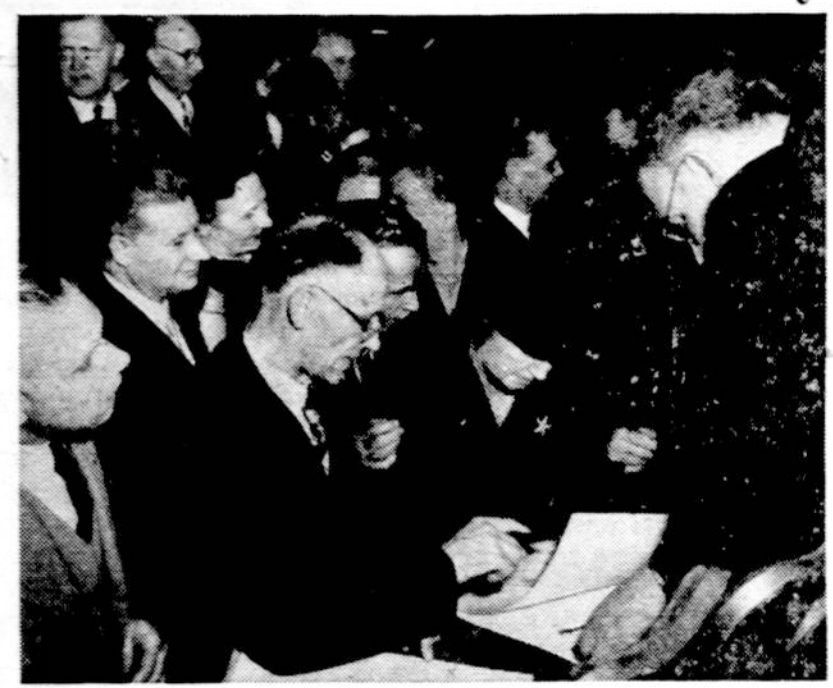
Iškilmų dalyviai pasirašo JAV Lietuvių Bendruomenės aktą.

Po griausmingos dainos gražiai pasipuodūsiai tautiniais drabužiais Amerikos lietuvių Matulionytė perskaitė šį iškilmingą aktą: