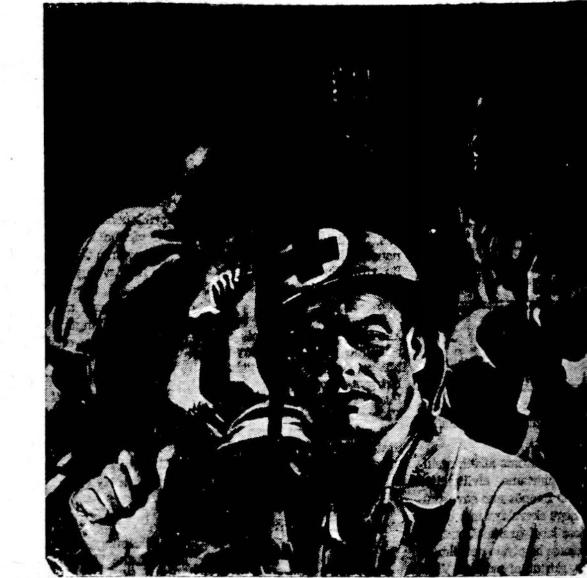
MATOTE, KAM REIKALINGAS JESU KRAUJO LAAS. KREIPKITES DAR ŠIANDIEN Į RAUDONAJI KRYŽIU (RED CROSS) IR PAAUKOKITE KRAUJO KARIŲ GYVYBEI GELBĖTI TAI JOS GALITE ATLIKTI SAVO GYVENAMOJE VIETOJE.

b) ALRK Federacijos Taryba sveikina tėvų pranciškonių pastangas, apjungusias tris mūsų lokalinius laikraščius, ko lietuvių katalikai jau seniai siekė tikslu turėti sustiprintą vieną jungtinį laikraštį; Taryba džiaugiasi jų vietoje dabar