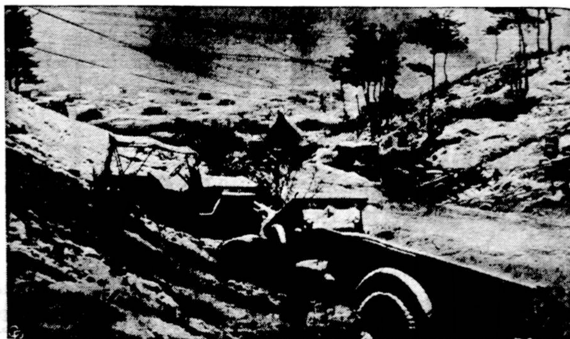
Korejoje yra jau prasidėjusio sniego pūgos. Matome užklutusius sunkvežimius, automobilius ir gurkules. Iš to galima suprasti, kokios yra sunkios karanti sąlygos. Tai jau antra žiema Korejoje.

Washingtonas. — Sausio mėnesį susirinkęs kongresas bus paprašytas iširti pranešimus apie komunistų Korejoj įvykdytus žiaurumus ir surinkti medžiagą bylai tarptautiniame teisme, panašiai, kaip buvo teisiami karo nusikaltėliai po praėjusio pasaulinio karo.