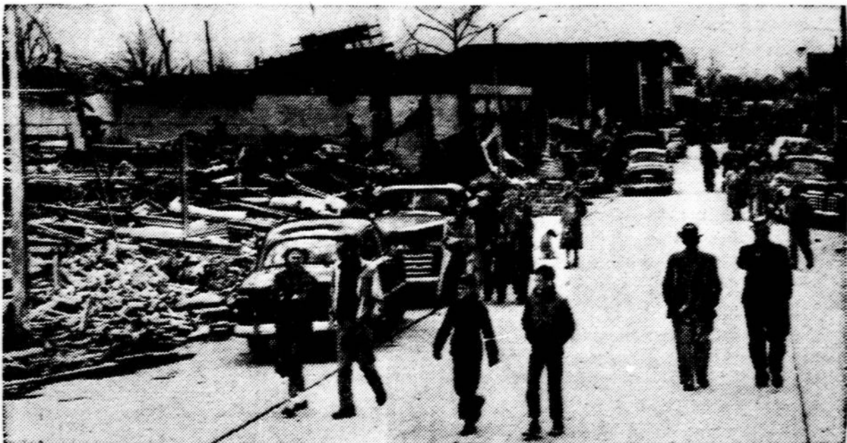
Beveik visai audros sugriauto Judsonia, Ark., miesto pagrindinė gatvė, audrai praėjus. Tik Judsonijoje buvo užmušta 25 asmenys. Viso audra pietuose sunaikino apie 1007 namus ir 1348 apgriovė.

Kai vėl susėdome į vežimą, aš savo bičiuliui paklausiau, ar jis visada mauna ant ratų "Goodyear" padangas, kaip šį jungininkams buvo svarbu tą sukilimą sulaukyti, kad būtų kliudomas darbas kaučiuko plantacijose, kuriose dirbo kinai. Malajuose jų yra daugiau kaip du milijonai. Numetus ginklus, jie šaudė iš kiekvieno