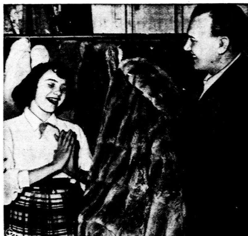
Chicago aukcione Barbare Ma-nausa tėvui netikėtai pavyko savo dukrelei už $550 nupirkti $25,000 vertės kailinius.

— Šv. Trejybės bažnyčioje šį trečiadienį baigėsi šv. Juozapo Novena ir rekolekcijos, kurias labai sėkmingai pravedė Tėvas Mažukna, MIC. "X"