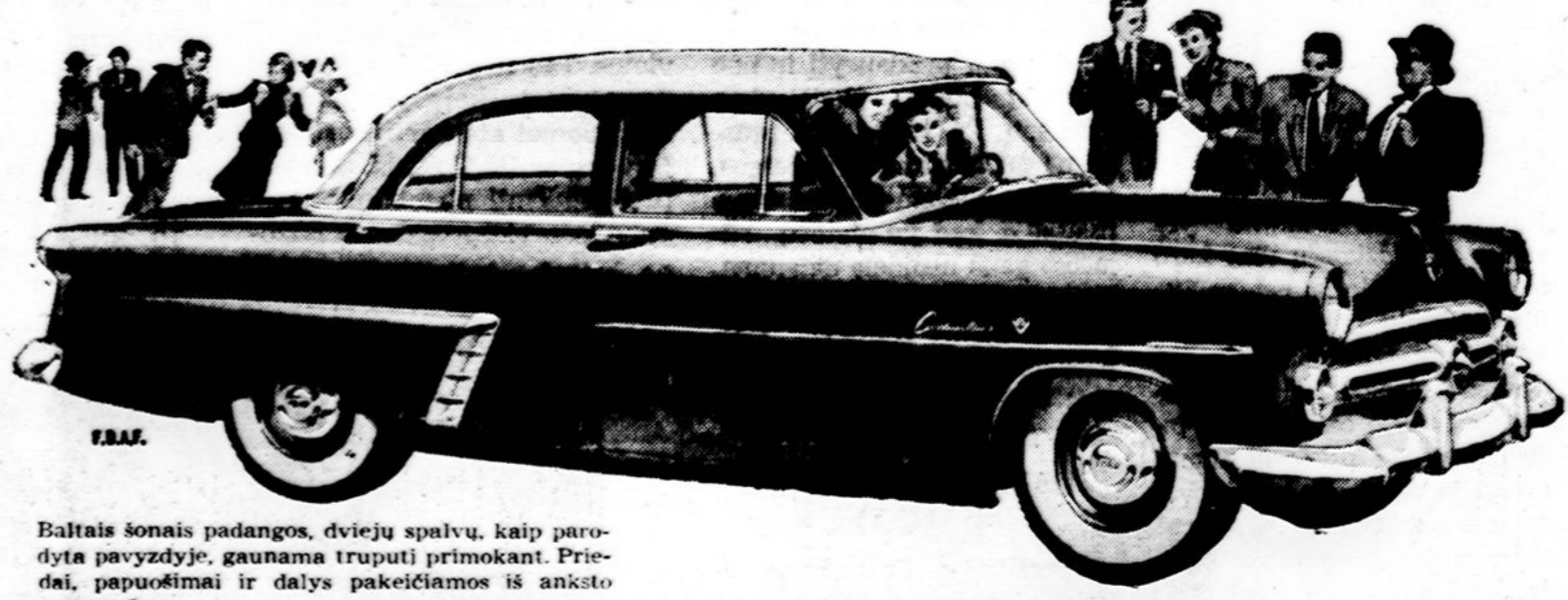
Baltasis sonas padangos, dviejų spalvų, kaip parodyta pavyzdyje, gaunama truputį primokant. Prieš, papuošimai ir dalys pakeičiamos iš anksto nepranešus.

Daug metų automobilių gamintojai galvojo, kaip padaryti mašiną, aukščiausios kokybės, bet žemos kainos. Šiais metais Fordas įtikino, kad jūs galite įsigyti automobilį aukščiausios kokybės, žemiausia kaina. Nenuostabu tad, kad Fordas yra mėgiamiausias automobilis Amerikoje. Nenuostabu, kad tokia daugybė žmonių reikalauja Fordo net ir tais atvejais, jei reikėtų ilgiau laukti.