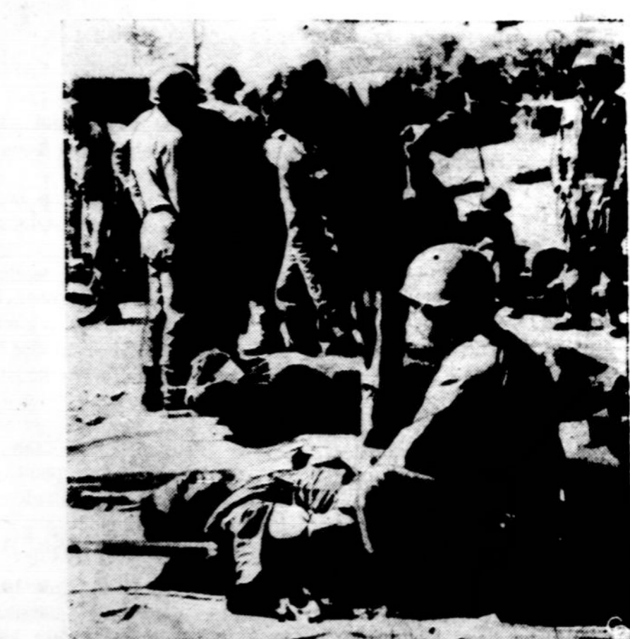
Sunkiose kovose Korejoje prie Triangle Hill sutelktiesiems teikiama pirmoji pagalba.

Londonas. — Lapkričio 4 d. karalienė Elzbieta iš sosto pasakė kalbą j parlamentą. Pareiškė pilną paramą JTO politikai Korejos kare; kėlė reikalą pieno ir susisiekiemo pramonę vėl supratinti; reikė pritarimo Atlanto Pakto veiklai ir solidarumą su JAV. — Tokiomis ceremonijomis prasideda kiekviena parlamento sesija. Karalienės kalba davė programą tos sesijos darbams.