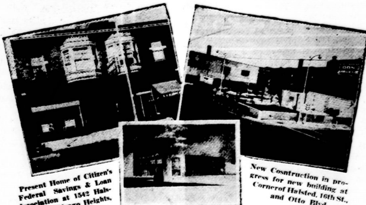
Present Home of Citizen's Federal Savings & Loan Association at 1542 Halsted St. in Chicago Heights, Ill.