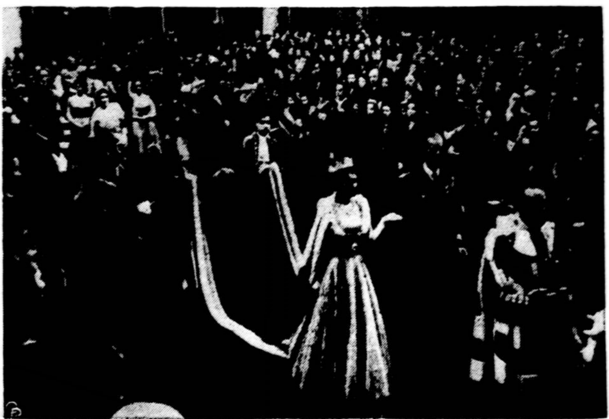
Anglijos karalienė Elzbieta II su didele iškilme atidarė naują parlamento sesiją, pirmą kartą pasakydama sosto kalbą. Toje vyriausybės paruoštoje kalboje jaunoji karalienė pasakė už artimus santykius su JAV ir Jungt. Tautų akcijos Korejoje rėmimą.

Kitose fronto dalyse vyko tik mažesnio masto susirėmimai.