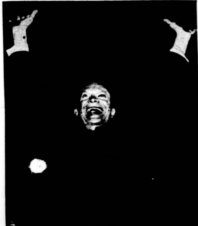
Eisenhoweris džiūgaujantis, laimėjęs rinkimus.