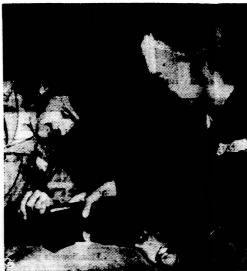
Gen. Eisenhowerio sūnus majoras John Eisenhower (dešinėje) Korojeje sėka per radiją JAV rinkimų eiga.