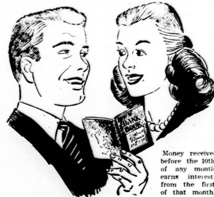
Money received before the 10th of any month earns interest from the first of that month.

Only with a Savings account will you enjoy that safe secure feeling that you're prepared for any emergency. At CITIZEN'S FEDERAL your savings will earn substantial dividends. In addition we give personal attention to all your financial problems whether large or small. COME IN AND SEE US TODAY.