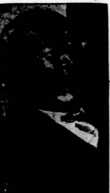
Pietų Korėjos prezidentas S. Rhee spaudos atstovams pareiškė, jog vienos Pietų Korėjos karinės pajėgos nestengia komunistams atsipirti. Nuomone, kad Pietų Korėja turi pakankamai karių pakeisti fronte amerikiečius, Rhee griežtai atmeta.

Dėmesio vertas kaip tik šiomis dienomis pranešimas iš Maskvos, kad Sovietai esą toli pralenkę Vakarų atominės energijos srityje.