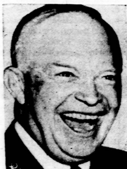
Gen. D. Eisenhoweris, laimėjęs rinkimus, žada tuojau pat skristi į Koreją ir iširti, kaip galima būtų greičiau laimėti ten taiką. Visi sušidomėje laukia, kaip jam tasai pirmasis žingsnis pavyks.

Washingtonas. — Laimėjęs prezidento rinkimus gen. Eisenhoweris gavo daugiausia balsų visoj JAV istorijoje. Viso balsavo beveik 60 milijonų. Iš jų jau suskaičiuota per 56 milijonus, iš kurių 31,024,749 už Eisenhowerį (55,4%). Elektorių atžvilgiu ligi šiol jau paaiškėję, kad Eisenhoweris pirmąją 39 valstybę, iš kurių gauna 442 elektorių balsus. Tuo tarpu Stevensonas tik 9 valstybėse su 89 elektoriais.