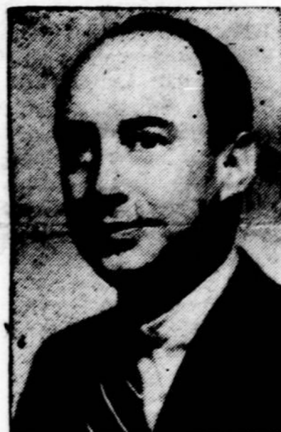
Pralaimėjęs rinkimus, demokratų kandidatas gen. A. Stevensonas pareiškė, kad tas pralaimėjimas jam labai skaudus. Tačiau tuojau pat pasuntė savo varžovui gen. Eisenhoweriui telegramą, kurioje jam palinkėjo sėkmingai vadovauti šiais sunkiais laikais JAV.