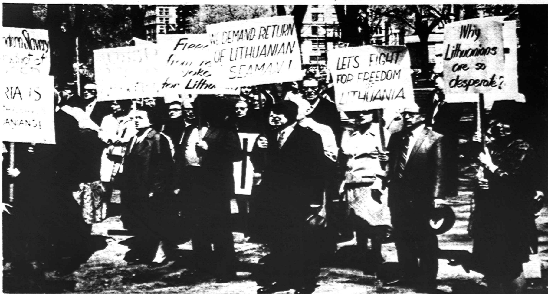
Plakatai demonstracijose Bostone. Jos buvo surengtos gegužės 13, reikalaujant paverptom tautom laisvės.