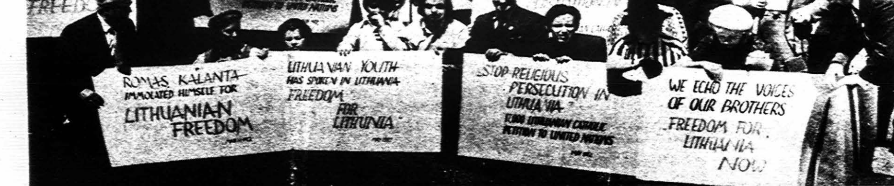
Times Square New York gegužės 29 buvo surengtos lietuvių demonstracijos ryšium su psichologiniais įvykiais Lietuvoje. Demonstracijose dalyvavo ir latvių, estų, vengrų, ukrainiečių atstovai.

Prez. Nixonas pakvietė Kremliaus vadus atvykti Amerikon. Pakvietimas priimtas su padėka. Vizito laikas nesutartas.