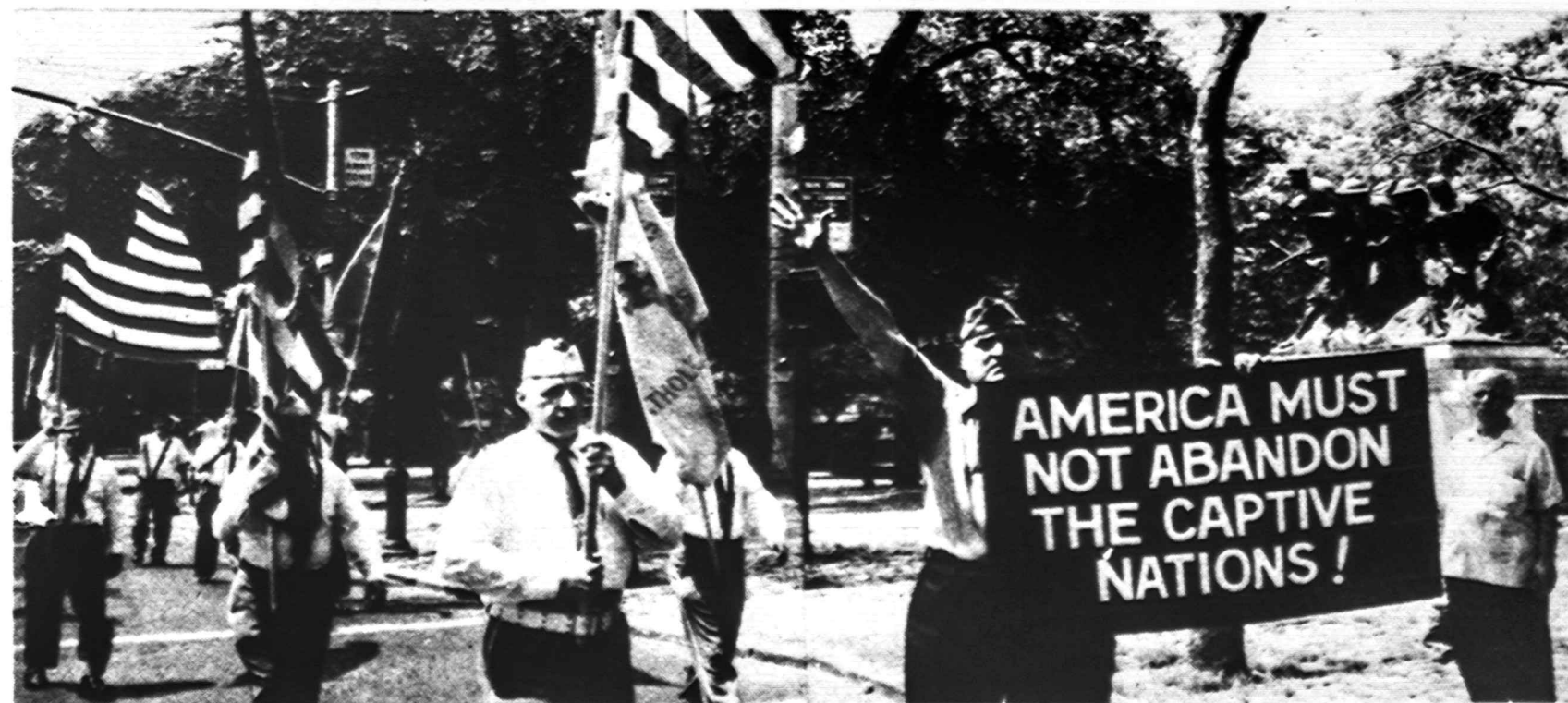
Queens katalikai veteranai pavergtų tautų savaitės parade New Yorke liepos 16 d.