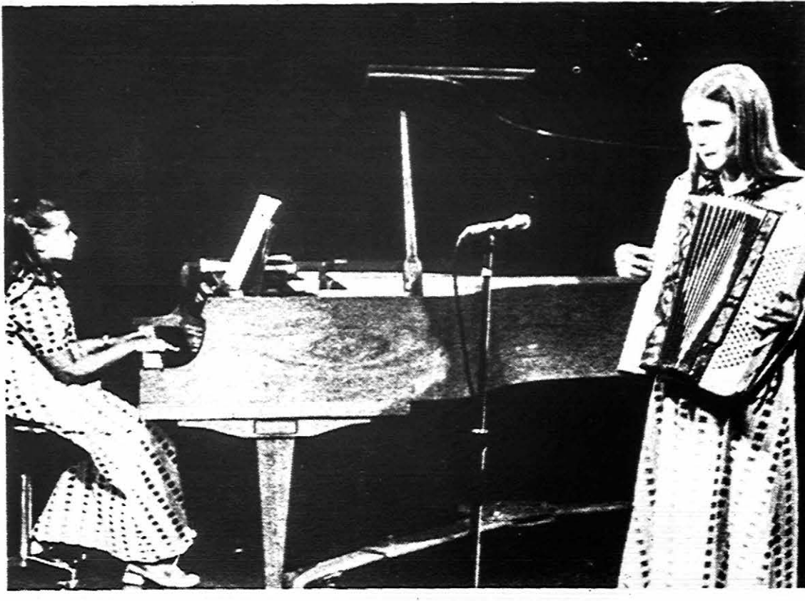
Chicago's lietuvių televizijos programoje lietuvių muzikos kūrinius atlieka J. Končiūtė ir Burokaitė.