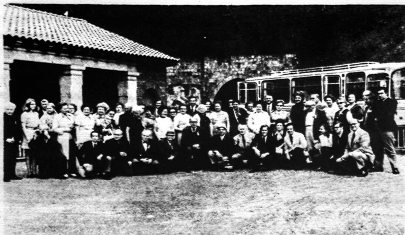
Lietuvos vyčių ekskursijos dalyviai Kolumbijoje prie druskos kalno, netoli Bogotos. Tame druskos kalne giliai po žemeis yra druskos katedra, kurią ekskursija aplankė birželio 24 d.

Pusei valandos dar buvome sustoję Santiago, Čilėj. Čia pa-