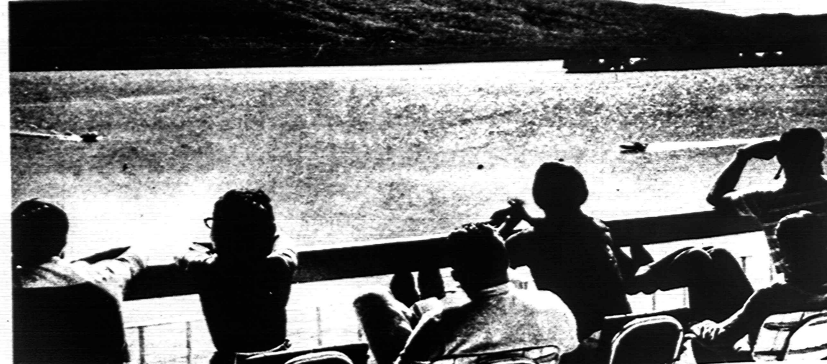
Adirondakų kalnų perlas — Lake George, kurio pakrantė yra gražioji lietuvių Slyvynų vasar- vietė Blue Water Manor, Diamond Point, N.Y. 12824. Tel. (518) NH 4-5071. Nuo New Yorko apie 200 mylių. Iš N.Y. Thruway Exit 24, į Nortway 87 iki Lake George Village; iš ten 9 N keliu 7 mylios į šiaurę. Nuotr. V. Mazelio

EDM MACHINE (LOX) Top Individual for both positions to set up and operate. Top Wages, Profit Sharing Plan, Overtime, Master Medical and Hospital Plan. Exc. Working Conditions. Air Conditioned Shop. Malden, Mass. 617-321-0480. An Equal Opportunity Employer.