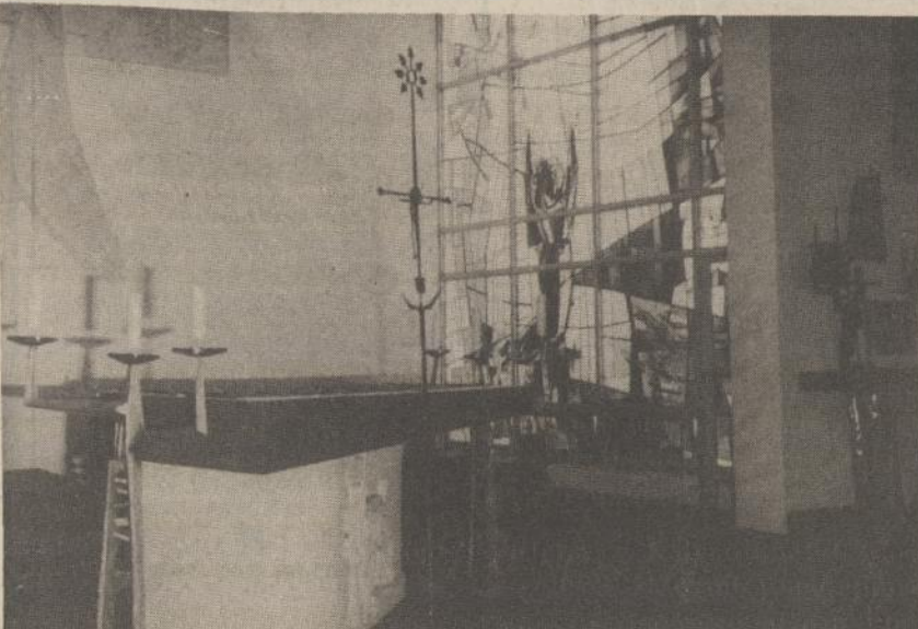
Pranciškonų koplyčios vidus, detalė. Dail. V. K. Jonyno kūryba.