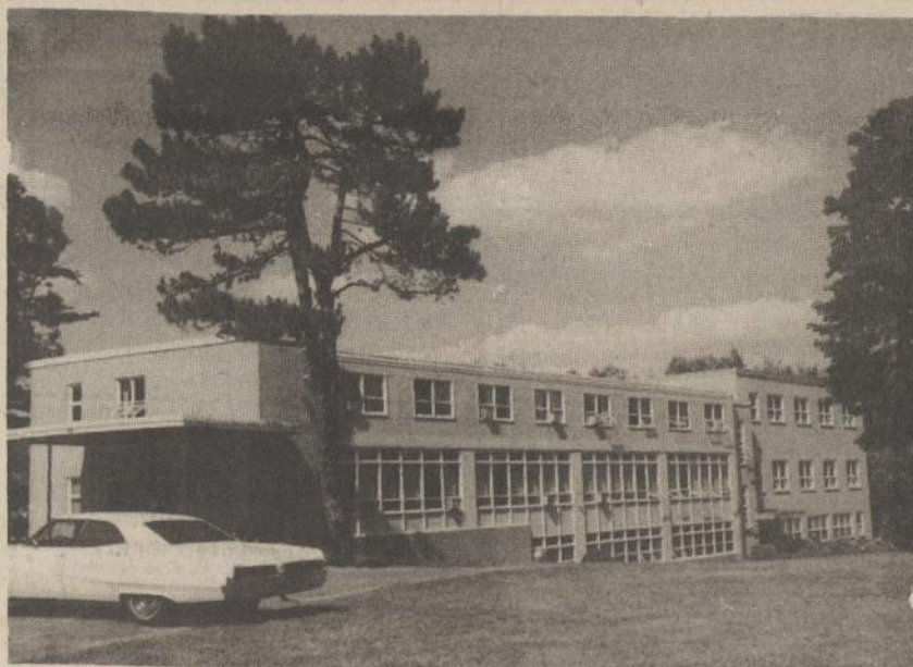
Pagrindinis vasarvietės pastatas — buvusi Sv. Antano gimnazija — dabar pritaikyta svečiam.

Tėv. L. Andriekus, OFM Vienuolyno vyresnysis