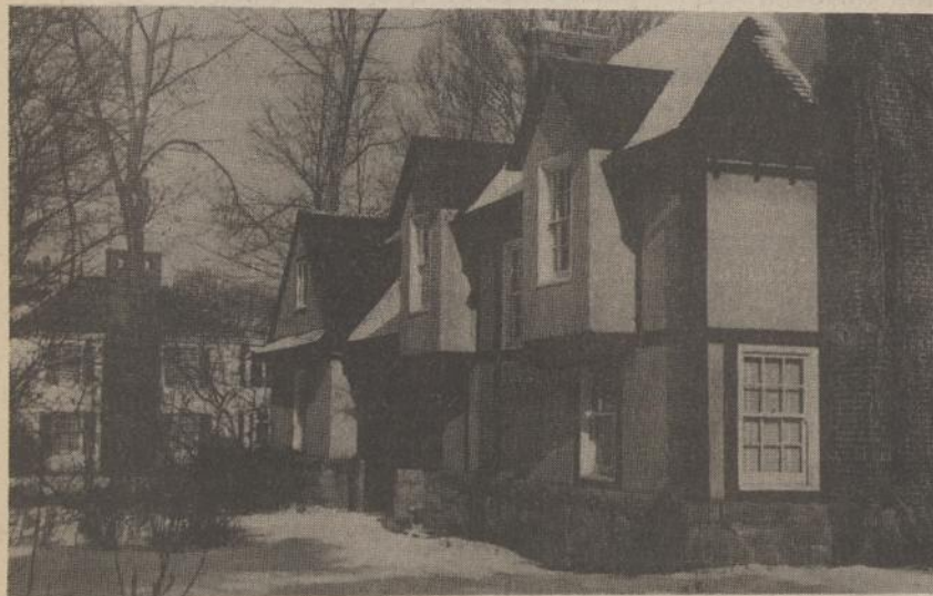
Mažesnieji vasarvietės pastatai.