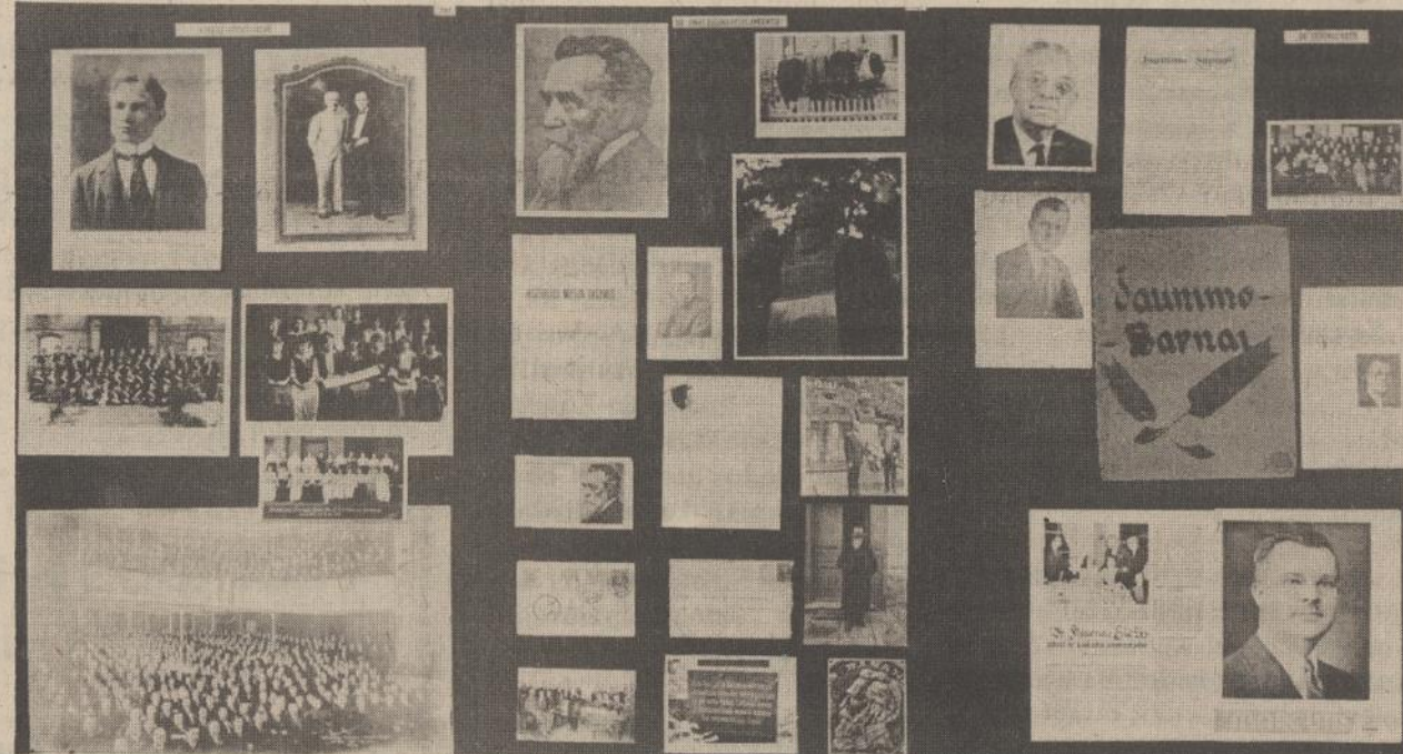
Ankstesniosios išeivijos parodos eksponatų dalis