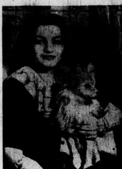
Persijos Princesė Ašaraf Reza, pozuoja, su savo mėgiama šuniu, laike jos atsilankymo į Stockholmą, Švedijoje.