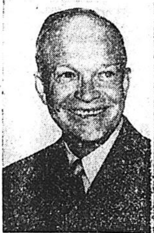
Dwight E. Eisenhower