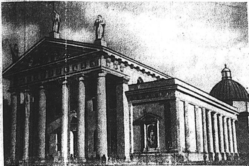
Vilniaus miesto gražioji šventovė — Katedra