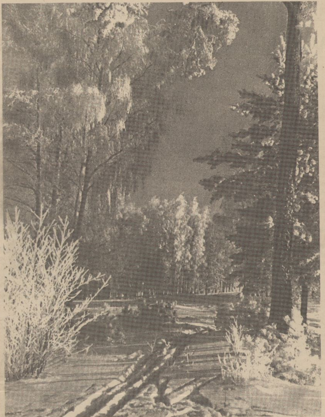
Žiema Zarusų apylinkėse.