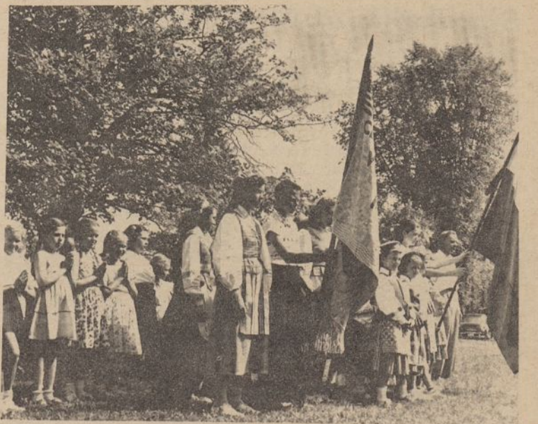
Dalis Clevelando Lituaniščių mokyklų mokinių su mok. J. Doorovolskiu praeitą sekmadienį įvykusios mokyklų šventės metu.