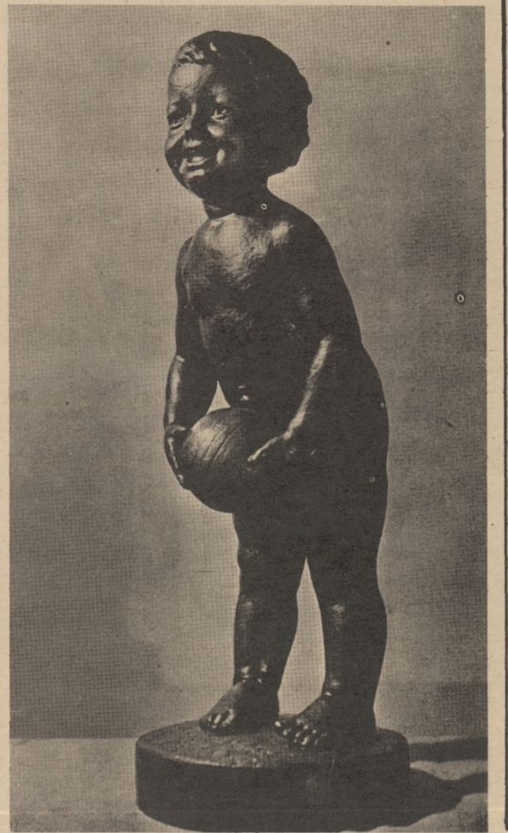
S. Žilytė-Bugailišienė: Mažoji sportininkė (gipsas)