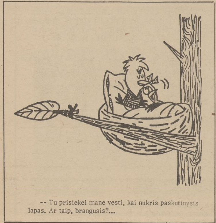
-- Tu prisieki mane vesti, kai nukris paskutinis lapas. Ar taip, brangusis?...

Balsų skaičiavimo komisijos sąstatas bus paskelbtas prieš balsavimą.