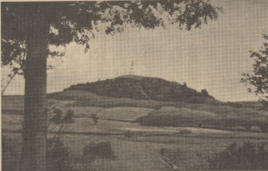
Šatrijos piliakalnis Žemaitijoje

Šių metų kovo 5-12 d. buvo surengta grupinė dailės paroda. Joje dalyvavo net 16 dailininkų su 80 kūrinių. Senoji valdyba, priešakyje su