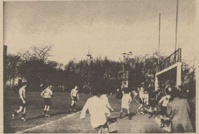
Chicago Lietuvos futbolininkai žaidžia pirmąsias "major" diviziono rungtynes Marquette parke, savoje aikštėje. Nuotraukoje mūsų futbolininkai susirėmę su Chicago vicemeisteriu Eagles (baltos uniformos). Aikštės tolumoje matyti lietuvių šv. Kryžiaus ligoninė ir bažnyčia.

LITUANICOS futbolininkai turėjo nusileisti trečią kartą mėginant laimėti "Major" diviziono pirmenybėse. Jų priešininku ši kartą buvo stiproka lenkų