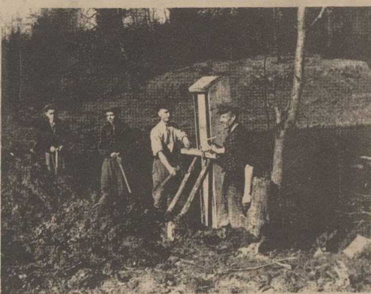
Komunistų valdomoje Lietuvoje, kur propaganda nuolat šaukia, kad kapitalistiniuose kraštuose žmonės išnaudojami, o pas save verčia dirbti jaunuolius 14-16 metų amžiaus sunkius laukų darbus. Nuotraukoje du 6 klasės gimnazistai, atostogų metu, prie nusausinimo darbų.