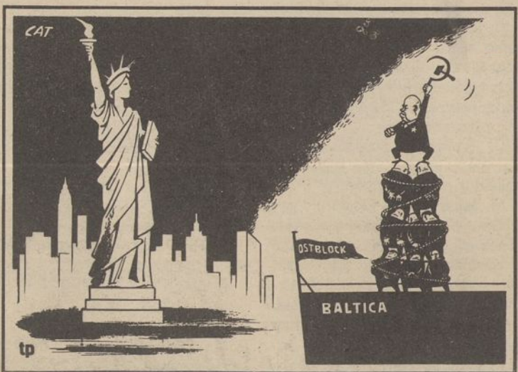
Dviejų blokų susitikimas