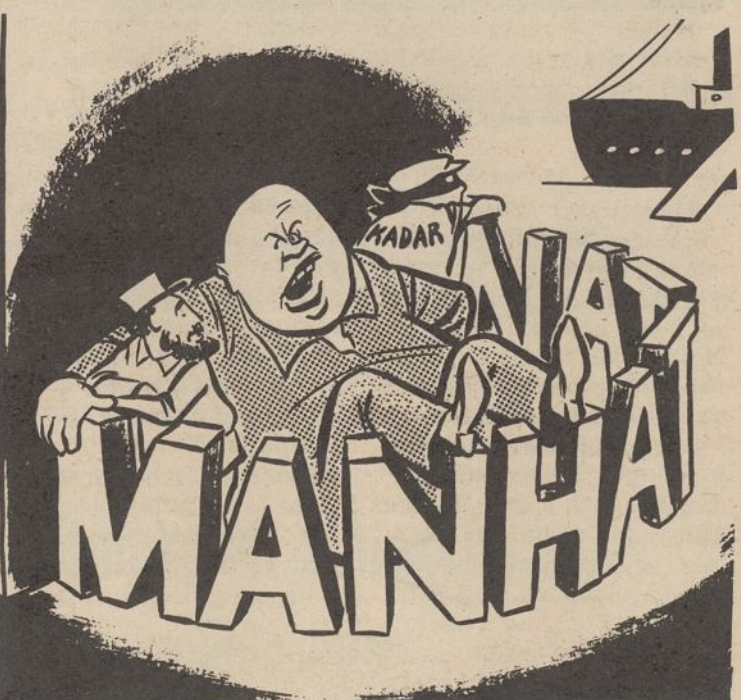
Chruščiovas Kadarui ir Castrui: - Kiek toli jūs galite nuspliauti?...

Beje, šio vizito dėka New Yorkas šiandien tapo trečiuoju, po Berlyno ir Panmunjono, miestu pasaulyje, kuris dėl sovietinių svečių buvo padalintas į du sektorius.