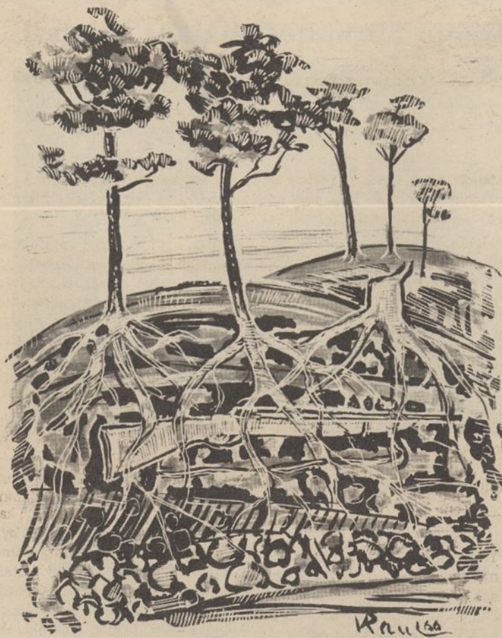
...mano šautuvas šilainių pušyne jau seniai surūdijęs... Vyt. Raulinaičio iliustracija

buvo ir ten mums gerai suprantamos, tik labai nuobodžios.