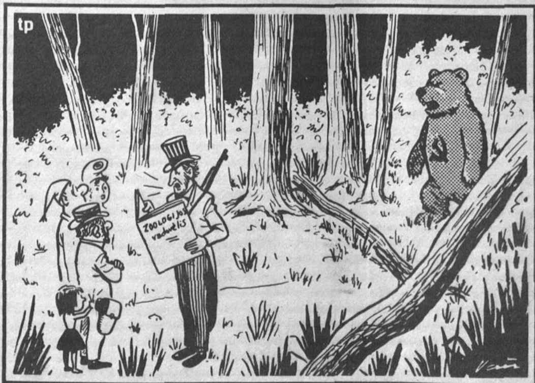
"Aš su juo pakalbėsiu. Gal jis dar nežino, kad jis yra vegetarinis gyvulus!"