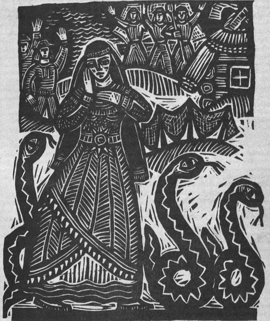
A. Makūnaitės lino raizynys "Eglė žalčių karalienė".

Alto pirm. Šimutis klausimus svarstyti pasiūlė tokia tvarka: 1) audiencijos procedūros nusta-