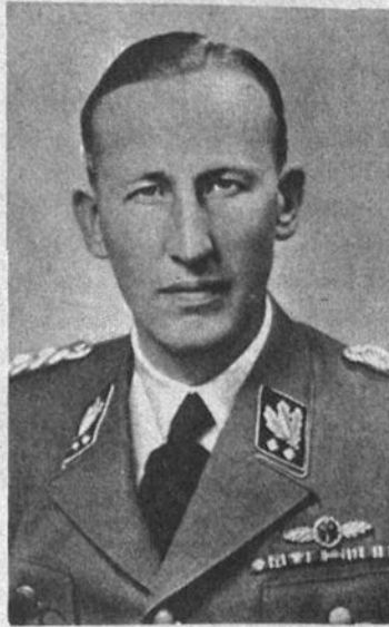
Reinhard Heydrich, Hitlerio vietininkas Čekoslovakijoje...