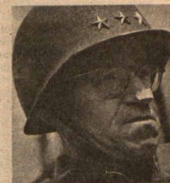
Omar Bradley liepos 24 pasiautė 2,246 bombonešius "nuvaityti" 20 kv. kilometrų plotu...

Kilo klausimas, kas daryti su civiliais tame trikampyje. Išpėti juos pasišalinti buvo neįmanoma, nes vokiečiai sužinoję apie pasiruošimus, laimė, ten buvo jų nedaug.