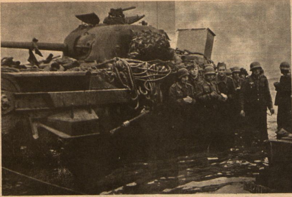
Hitleris jiems buvo pažadėjęs parodą Piccadilly aikštėje ir jų žygio dainos žodžiai buvo "Mes norime vykti į Angliją". Pirmąją invazijos dieną jų svajonės išsipildė... 5000 vokiečių belaisvių buvo sulaiptinti į laivus ir pasiūti į Angliją. Nuotraukoje, vokiečių belaisvių grupė, paplūdimy dar tebevykstant mūšiai, įbridę vandenin laukia prisitariant plauto, kuris perkels juos ant laivo ir nugabens į Angliją...