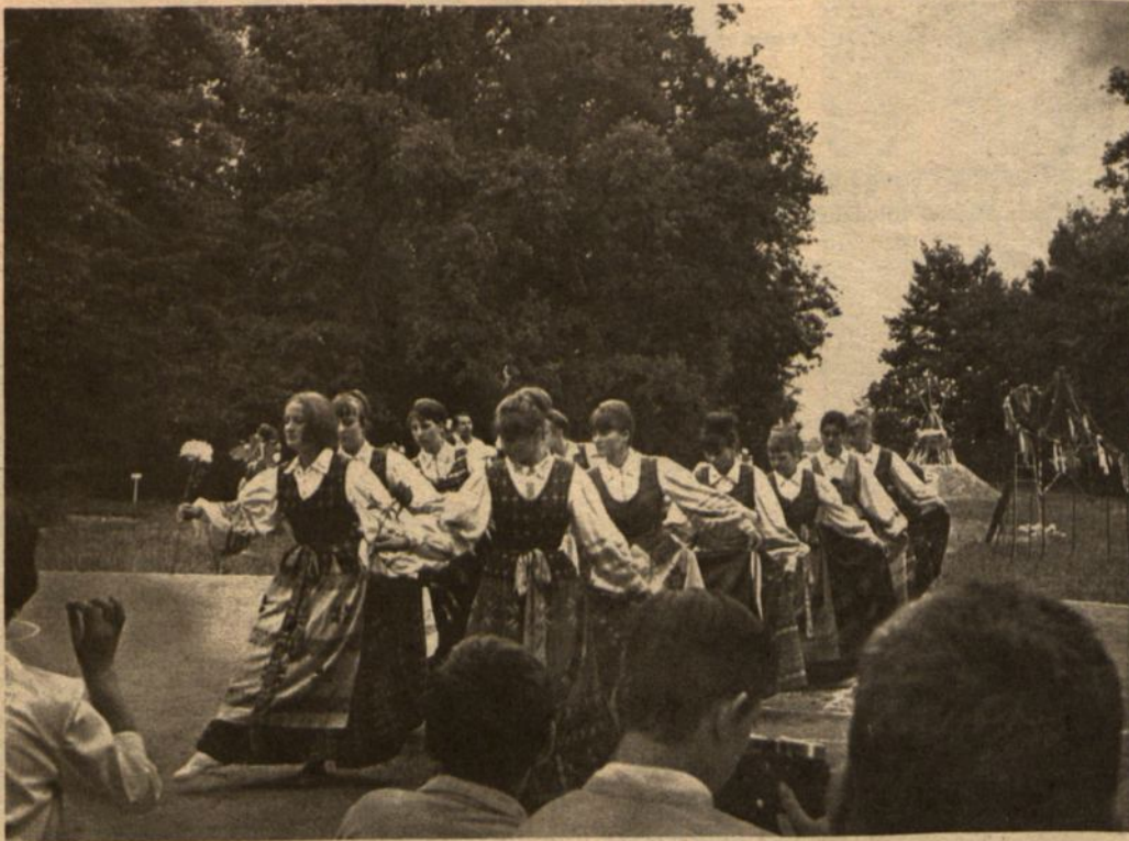
Vasario 16 gimnazijos mokinės išpildo tautinius šokius Joninių šventėje.