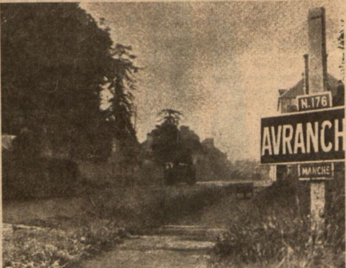
Keltas į Bretaniją, kur vokiečiai pralaimėjo Prancūzijos mūši.

Tarp kongreso priimtų rezoliucijų yra ir skatinimas rūpintis, kad ir šių metų abiejų partijų platformose Lietuvos klausimas būtų tinkamai įtrauktas. Daug ar nedaug bus iš to naudos, bet kažin ar ne daugiau, negu "į geras rankas atiduoto" memorandumo.