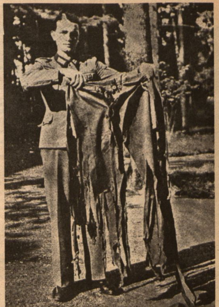
1944 m. liepos 20 d. bomba nenužudė Hitlerio. Jį tik sudraskė jo kelnes...