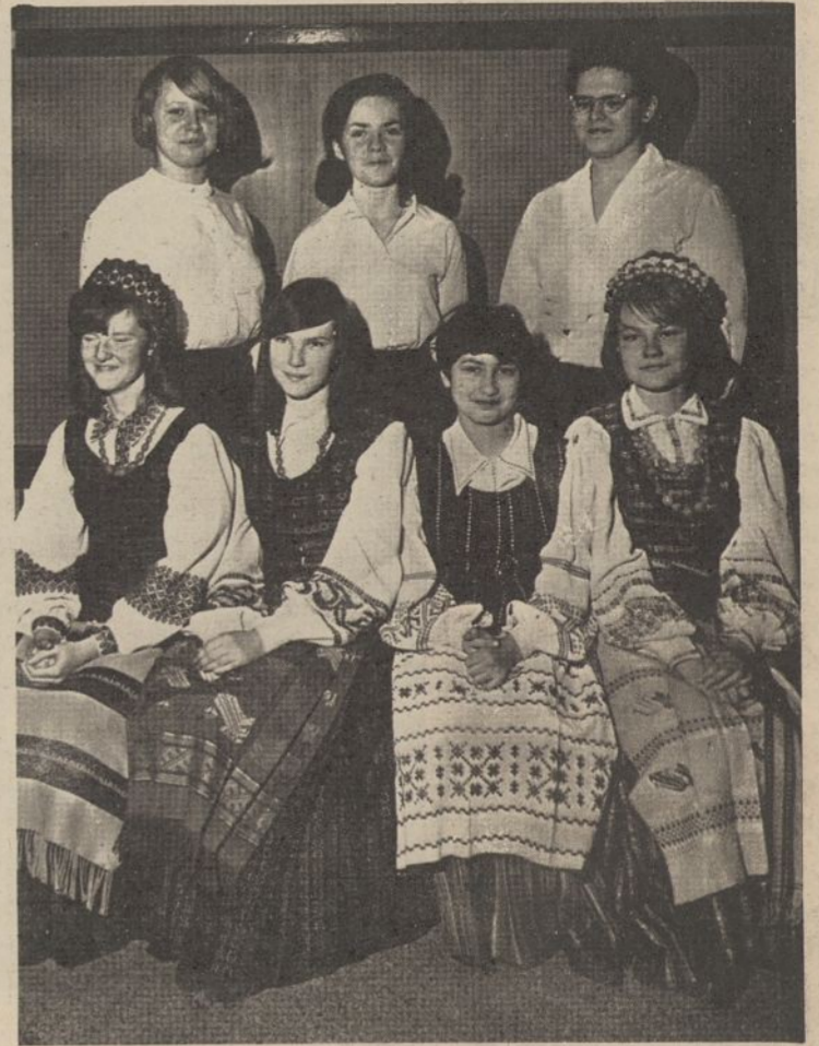
Grupė Detroito choristų, dalyvausiančių Dainų Šventėje Chicagoje.