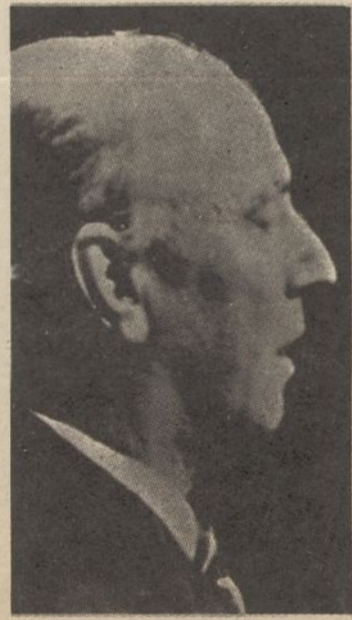
Švedų pramonininkas Dahlerus daug dėjo pastangų, kad taika būtų išgelbėta.

sivilės atsakymu, kuriame nebuvo nieko užsiminta apie Anglijos-Vokietijos sąjungą, ko jis labiausiai laukė, tad paklausė: