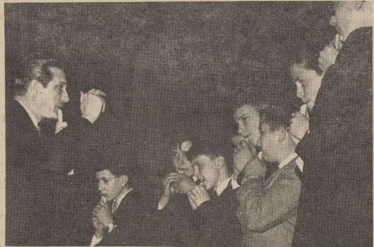
Toronto skautų Mindaugo draugovės skudučių orkestras, vadovaujamas S. Kairio, dalyvavęs jaunimo vakare.