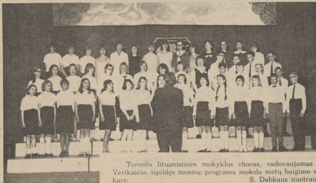
Toronto lituanistinės mokyklos choras, vadovaujamas V. Verikaitis, išpildęs meninę programą mokslo metų baigimo vakare.