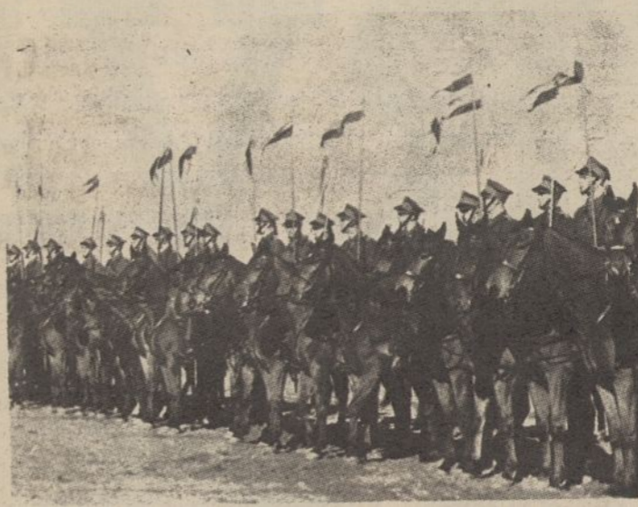
Pulk. Beck buvo tikras, kad lenkų kavalerija už kelių dienų bus Berlyne...

Nuo rugpiūčio 24 d. 25 pėstininkų divizijos, didžiama kavalerijos divizijų ir specialūs daliniai, arba tris ketvirtadaliai lenkų karinių jėgų, jau buvo paruošties stovyje. Karininkai, puskarininkai ir kareiviai buvo iššaukti specialiais kvietimais, vengiant išskabinti mobilizacijos skelbimus. Bet lenkų kariuomenės štabas galvojo, kad to neužtenka. Beck, kaip ir maršalas Rydz-Smigly, galvojo, kad lenkų armija užtenkamai pajėgi atsilaikyti prieš vokiečius, kad lenkų kavalerijos lankstumas laimės prieš vokiečių šarvuotus ir per keletą dienų užims visą Rytų Prūsiją. Lenkų žvalgyba nenustojė kartojuoti, kad vokiečiai nei moraliai nei mediagiškai nepasiruošę karui, kad vokiečių liaudis tuojau sukilsianti prieš Hitlerį ir per 48 valandas nacių