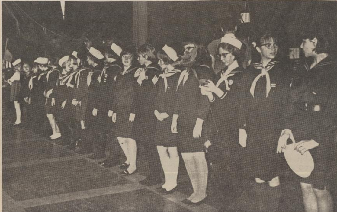
Jūrų skaučių gretos Klaipėdos uosto mugės atidaryme.