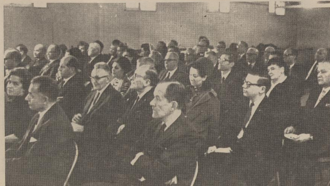
Laisvės žiburio radijo valandėlės New Yorke rėmėjai dalyvavę susirinkime sausio 22 d.

Po minėjimo įvyks metinis San Francisco Lietuvių Bendruomenės susirinkimas ir naujos valdybos rinkimai.