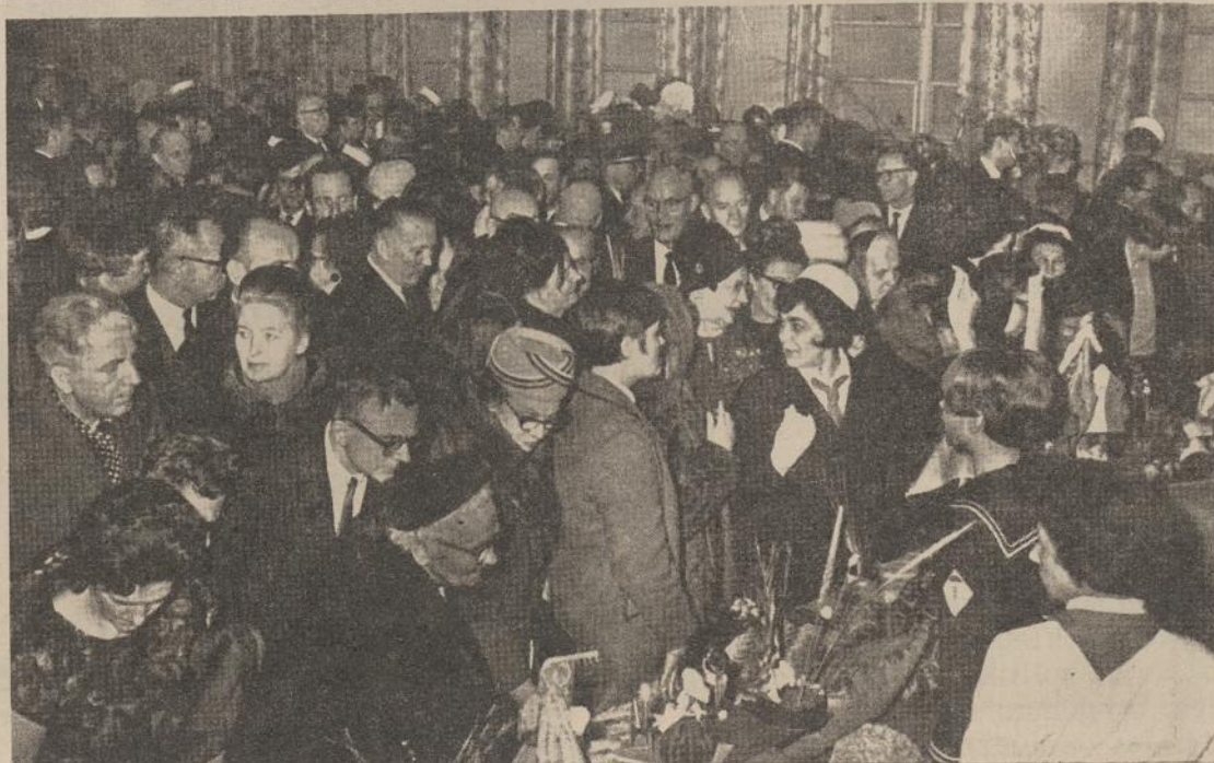
Mugėje buvo didelė spntis. Visi skubėjo apsipirkti ...