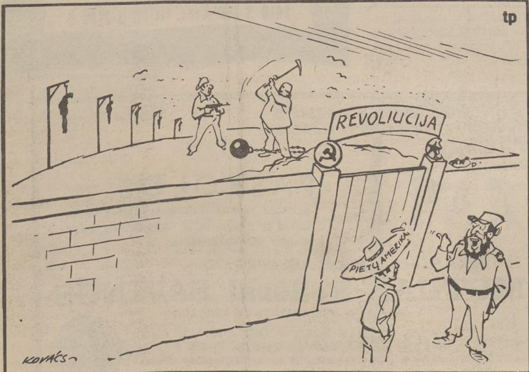
Cas tro: -- Už tų vartų tau prasidės naujas gyvenimas, kokio tu net negali įsivaizduoti!...