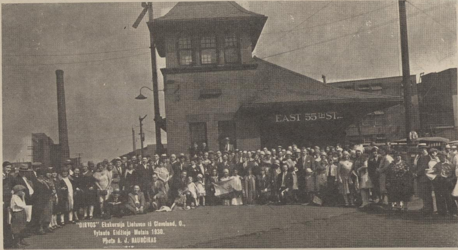
IŠ PRAETIES ARCHYVŲ... 1930 metais Dirvos surengtos ekskursijos į Lietuvą dalyviai ir juos išlydintieji bičiuliai Clevelando geležinkelio stotyje.