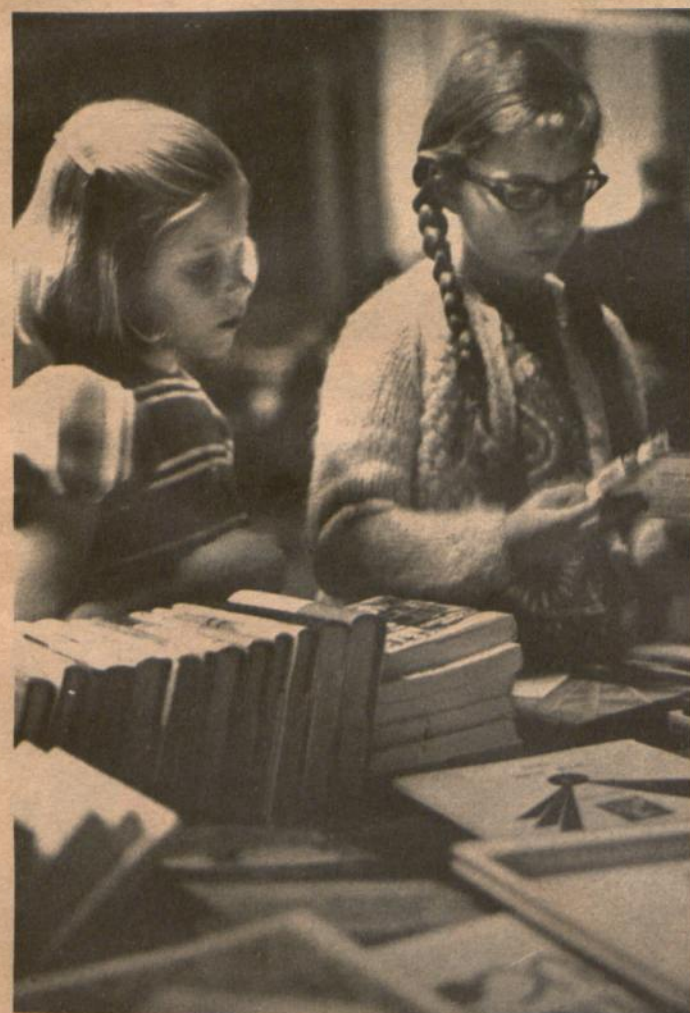
Kalėdų dovanai šią knygą nusipirksiu...

• JAV SENATO komisija bai-gia savo tyrinėjimus dėl auto-mobilių draudimo bendrovių veiklos. Pagrindinis taja veik-la nepasitenkinimas kyla dėl to, kad įvairiose valstijose taiko-mi labai įvairūs draudimo stan-dartai. Be to, draudimo bendro-vės yra monopolizavę pačios sau teisę nustatyti draudimo standartus.