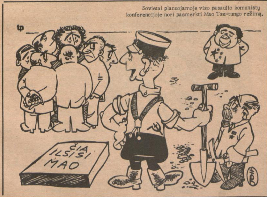
-- Pagaliau, ar ateisit padėti kasti duobę?...