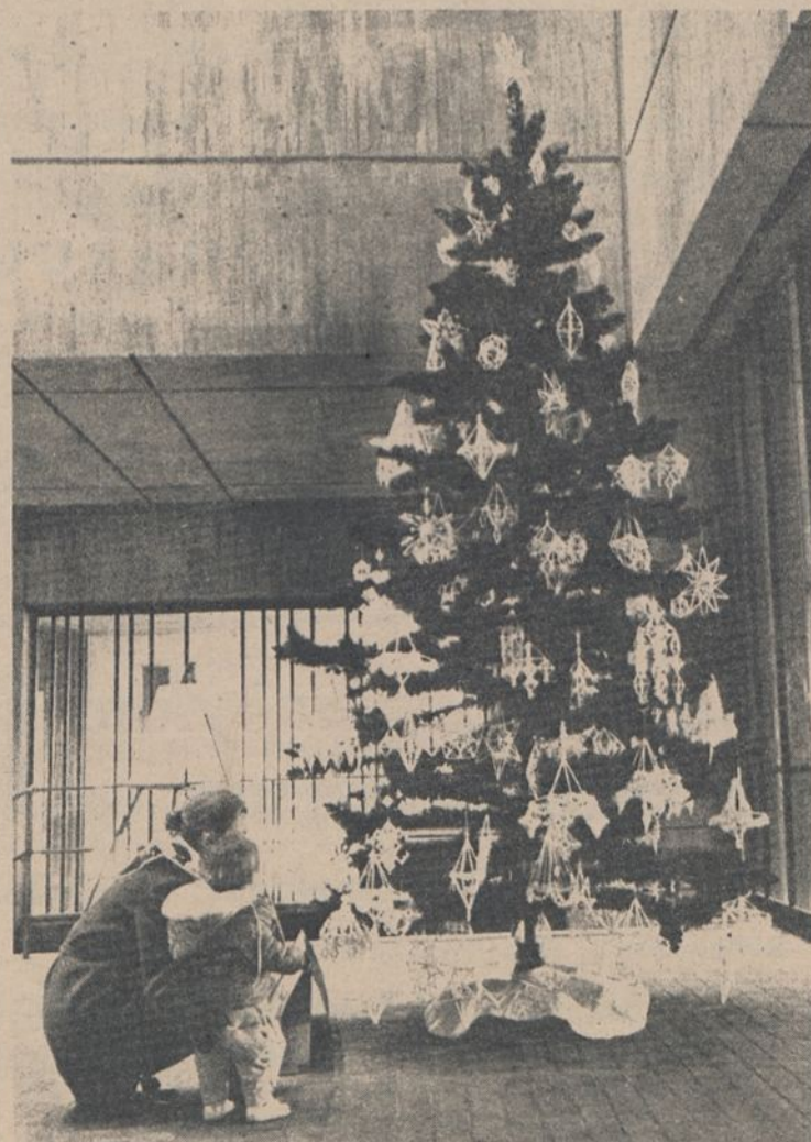
Prie kalėdų eglutės, kuri Bostono Skaučių Židinio papuošta stovi Bostono City Hall naujame pastate.