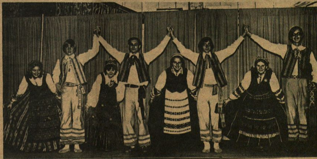
V. Stankienės vadovaujama taut. šokių grupė Žilvytis šoka tautų pasirodyne Navy Pier, Chicagoje.