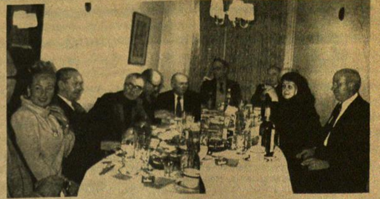
Po susirinkimo buvo vaišės ir susirinkusieji toliau tęsė diskusijas.