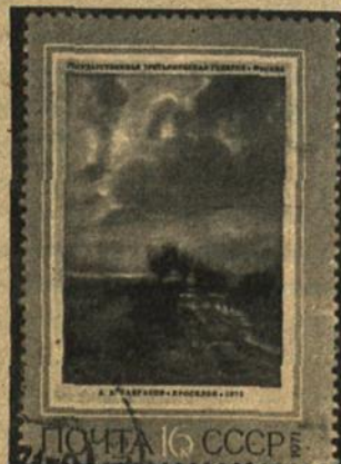
Savrasov Aleksej Kontaratjevič (1830-1897), rusų ta-

SOVIETŲ SAJUNGA jau kelintą kartą išleido spalvotų pašto ženklų serijas su jų žymiųjų dailininkų paveikslais. Čia dedame 16 kapeikų pašto ženklą su dail. Savrasovo paveikslu, tapytu 1873 m. Paveikslas yra valst. Tretjakovo meno galerijoje Maskvoje.