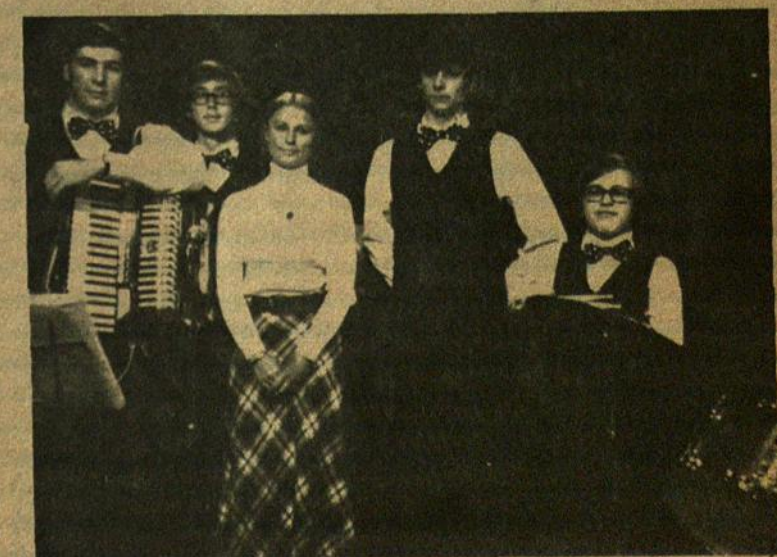
Muzikinė grupė 'Vytis' lietuviai Televizijoje pasirodymo metu. J. Šalmienės nuotrauka