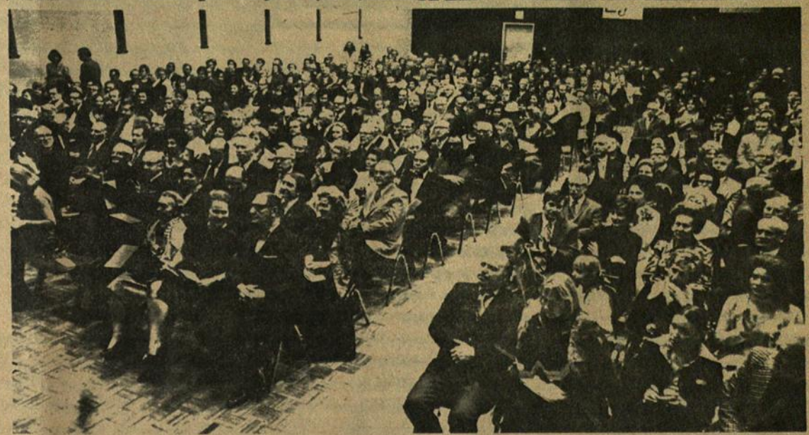
Viršuje New Yorko vyrų choras Perkūnas su simfoniniu orkestru koncerto metu Kultūros Židinyje sausio 19 d. atšventęs choro gyvavimo dešimtmetį. Apačioje gausi publika klausosi koncerto.