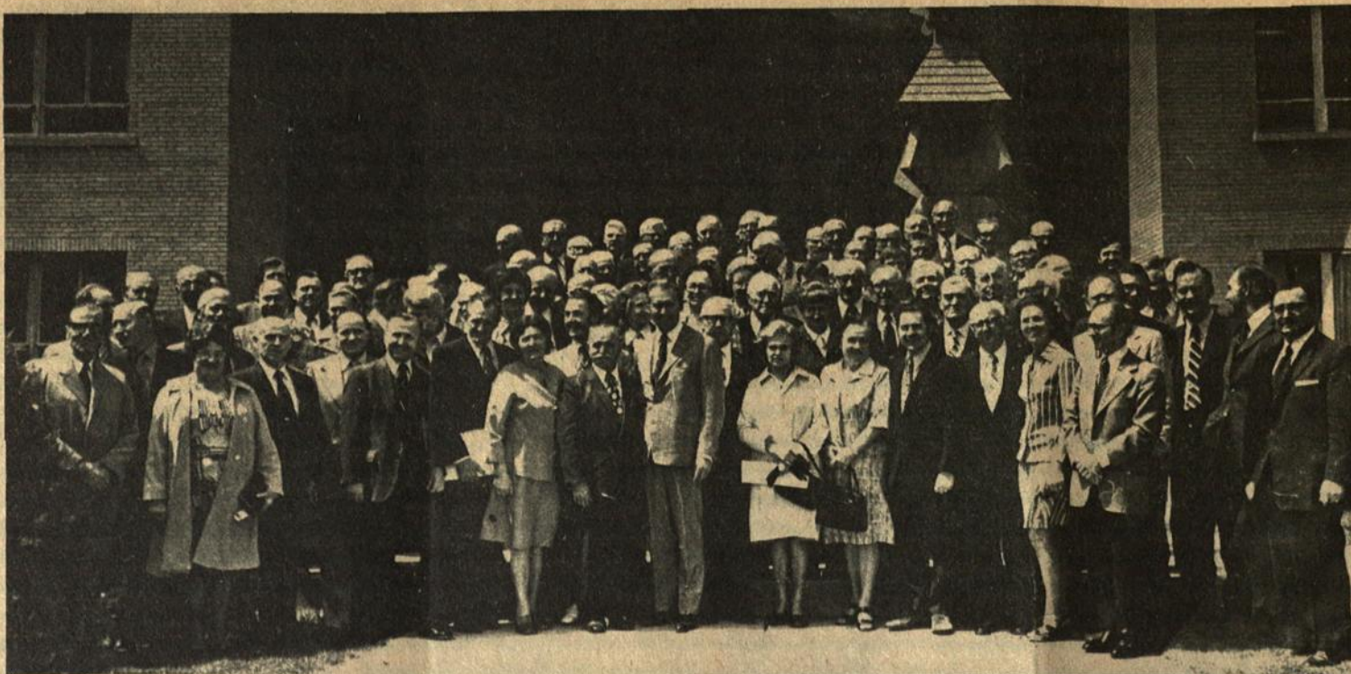
Bendras Lietuvių Fondo suvažiavimo dalyvių vaizdas prie Jaunimo Centro Chicagoje.