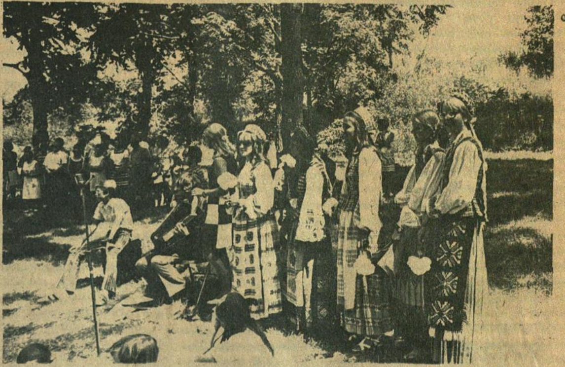
Mergaičių stovyklos Dainavoje stovyklautojos atlieka meninę programą.