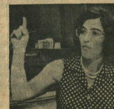
Elizabeth Holtzman, New Yorko atstovė kongrese.

Parodykite jos nuotrauką Dirvos skaitytojams ir