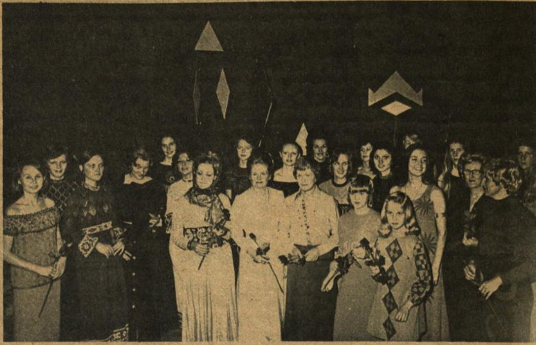
Iš Detroito skautų akademikų suruoštos madų parodos. Nuotraukoje dalis modeliuotojų ir parodos organizatorių.