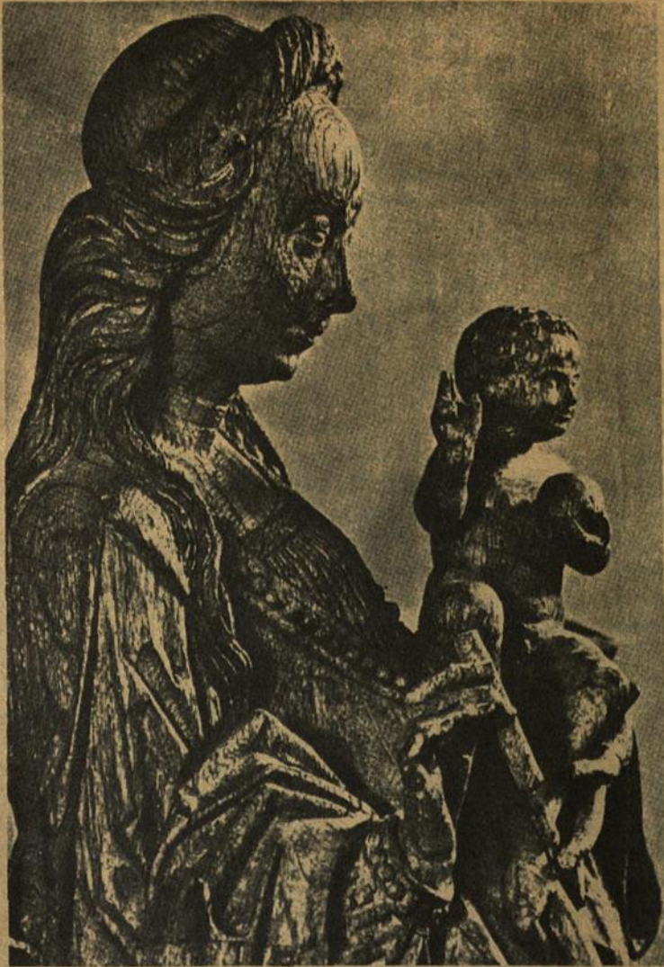
DIEVO MOTINA XVI amž. medžio skulptūra.

"Garbė Dievui aukštybėse, o žemėje ramybė jo mylimiems žmonėms", skelbia kalėdinė evangelija. Religinės šventės proga, šalia pasaulinės klaidų ir iliuzijų politikos, nejučiomis prisimename bažnyčios kunigaikščio kardinolo Josef Mindszenty tragediją. Jis atgaivino tai savo 'Atsiminimuose'. Drįstame sustoti ties Evangelijos tekstu: ar Dievo mylimieji yra kovotojai su ateizmu, ar santalkininkai su militaristine bedievyste?