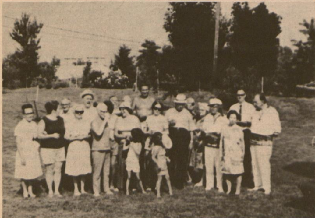
Baltimorės tautininkai iškyloje Grintalių sodyboje.