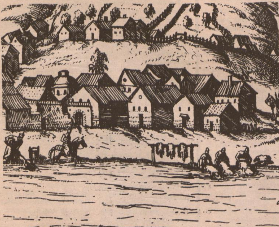
Odininkai prie Nemuno. Gardino miesto detalė iš Brauno ir Hogenbergo 1574 m. atlaso.