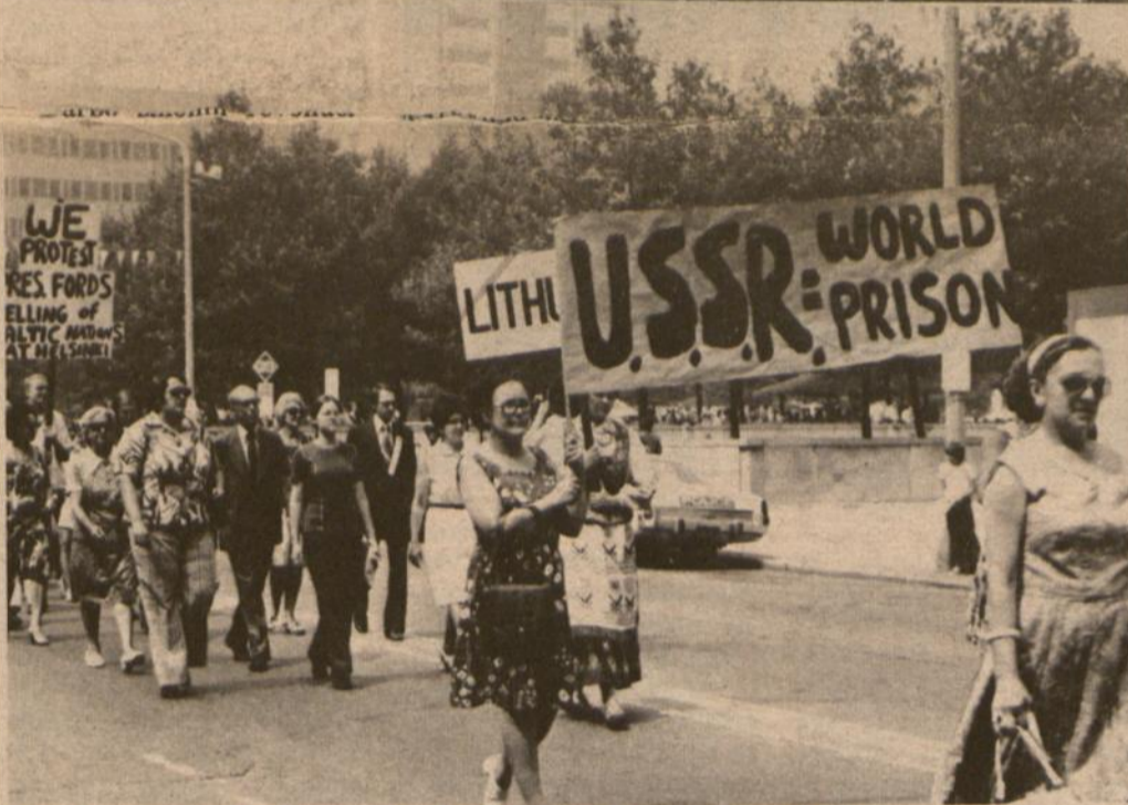
Pabaltiečiai dalyvavę Clevelande Pavergtųjų Tautų Savaitės minėjime. Apačioje lietuvių grupė parade su plakatais.

Su trupučiu fantazijos nesunku įsivaizduoti sekantį politinį biznį. Už amerikiečių nuolaidas surašant ir pasirašant Helsinkio deklaraciją, t.y. status quo Europoje faktinę pripažinimą, sovietai ne tik kad sutiko su Izraelio egzistencija, bet ir davė laisvas rankas amerikiečiams, tvarkant Izraelio-arabų santykius. Argumentų už tokią prielaidą nesunku rasti. Jei sovietai būtų daugiau kiršinę arabus, Vals tybės Sekretorius Kissingeris negalėtų dabar vėl nuvykti į Artimuosius Rytus naujo susitarimo tarp Egipto ir Izraelio suformulavimui.