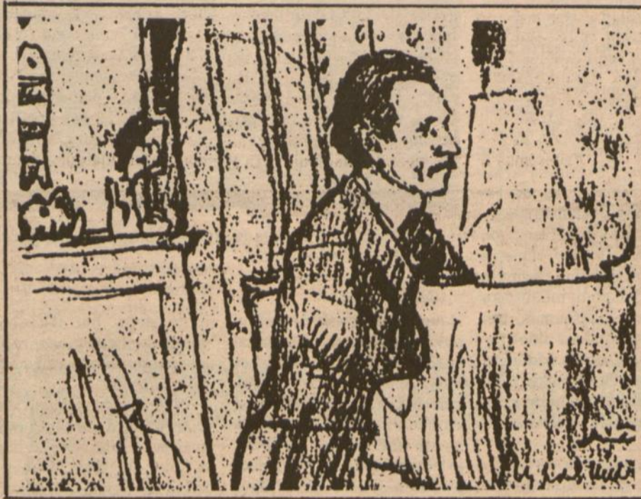
Retas M.K. Čiurlionio portretas, pieštas M. Dabužinskio 1908 m. pieštuku popieriuje.

Paroda atidaryta rugpjūčio 18 dieną, sutraukusi daug šventės dalyvių. Galerijos patalpos buvo pil-