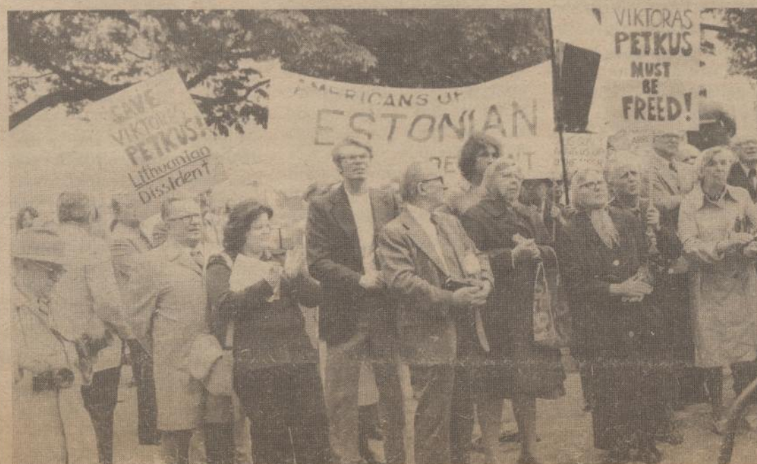
Dalis demonstruotojų su plakatais, susirinkę Clevelando miesto centre š. m. birželio 1 d., klausosi pranešimų.