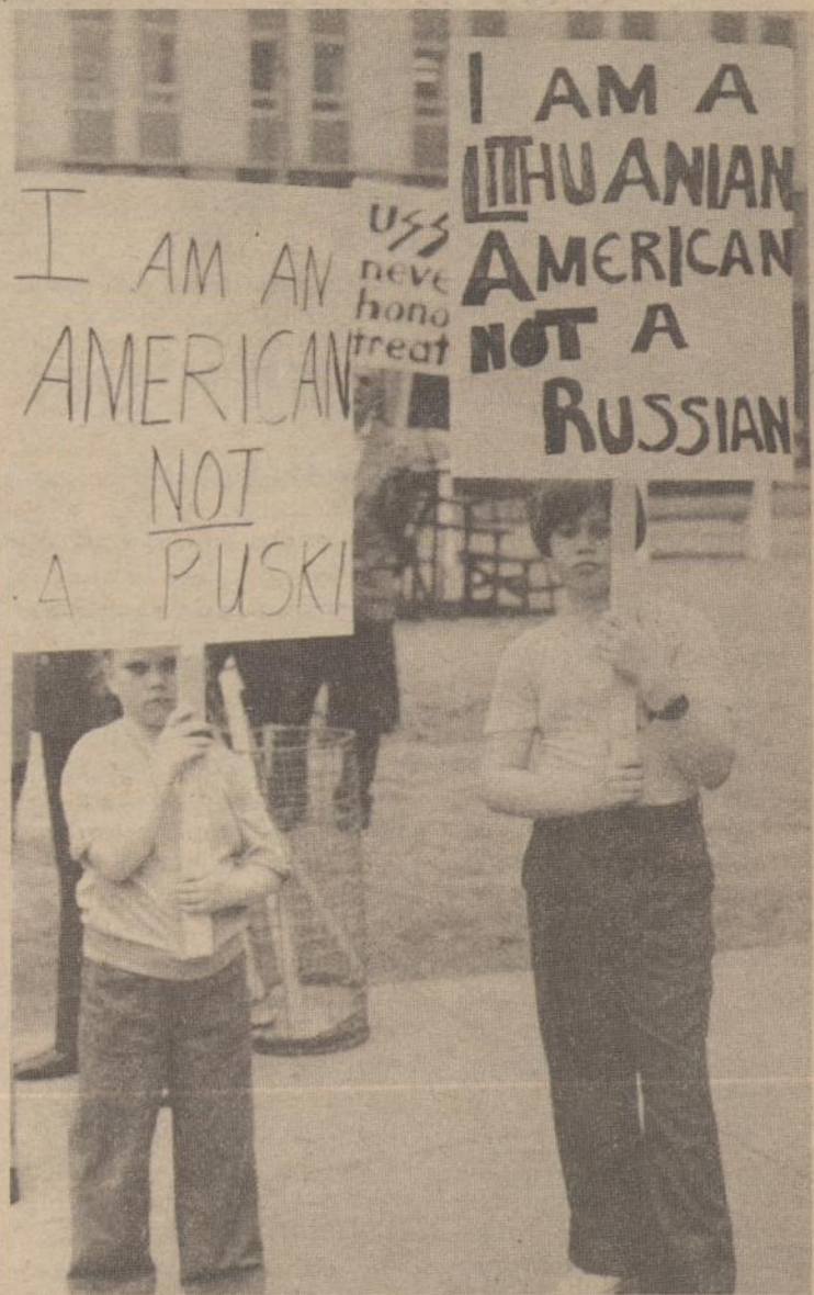
Jaunieji demonstrantai su plakatais.

Siuo metu didžiausi Sadato priešiniai yra Sirija ir Irakas. Abu kraštai glaudžiai bendrauja su sovietais. Pirmais jaučiasi galįs vadovauti visam arabų blokui, ar bent duoti jam toną. Abiejų kraštų režimai nėra labai populiarūs ir yra reikalingi įtempimo, kad galėtų išsilaikyti. Turtingoji Saudi Arabija yra nusivylusi Sadatu, kad jis neatgavo arabams bent Jeruzalės, o taip pat ir Carterio administracija, kuri - pažadėjusi pilną Izraelio-arabų santykių sprendimą - iš tikro pasiekė tik Izraelio-Egipto sutarimo, kuris paliko kitus klausimus dar blo-