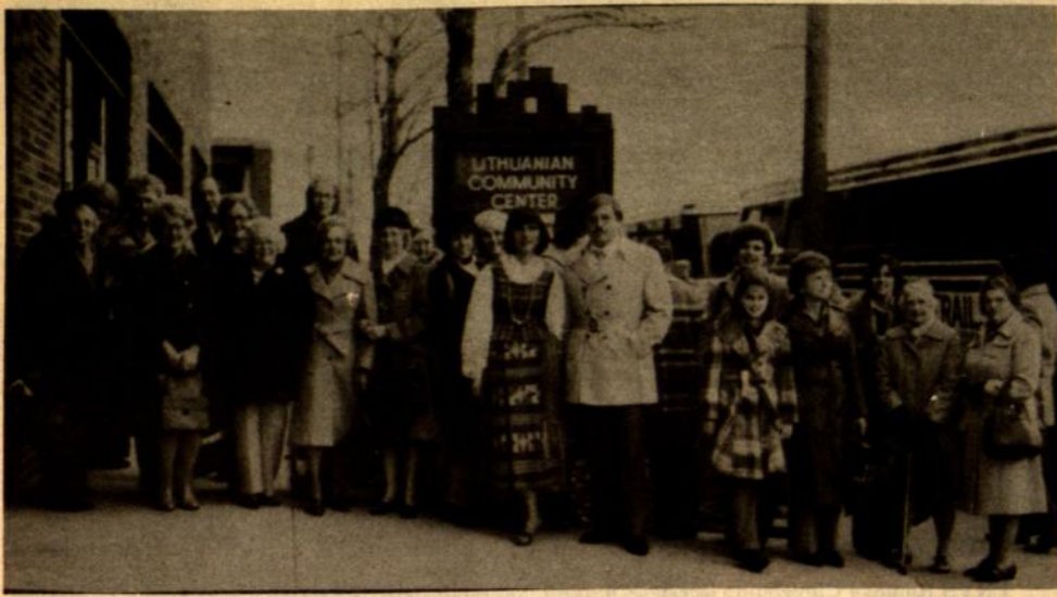
Clevelando lietuvių kolonija bus rodoma per 5-tą televizijos stotį, "Afternoon Exchange" programoje, ketvirtadienį, balandžio 10-tą dieną, tarp 4 ir 5 val. p. p.