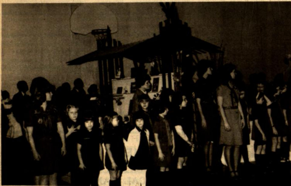
Atidarant Kaziuko mugę, išsiklavusios paukštytės ir skautės laukia svečių.