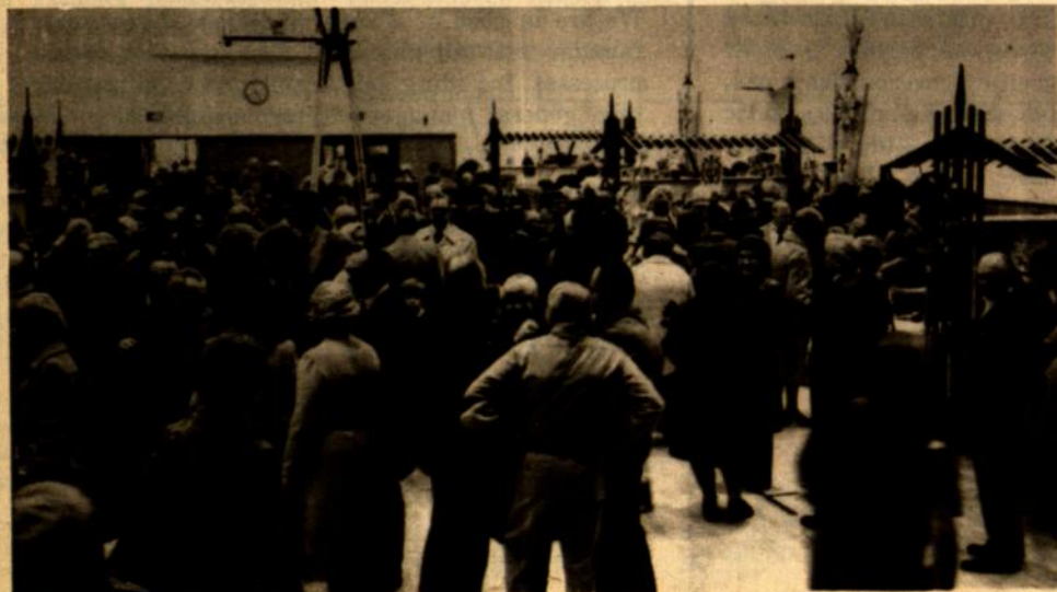
Clevelando skautijos rengtoje kovo 23 d. Dievo Motinos parapijos salėje Kaziuko mugėje buvo gausu lankytojų ir skautai padarė gražaus pelno.