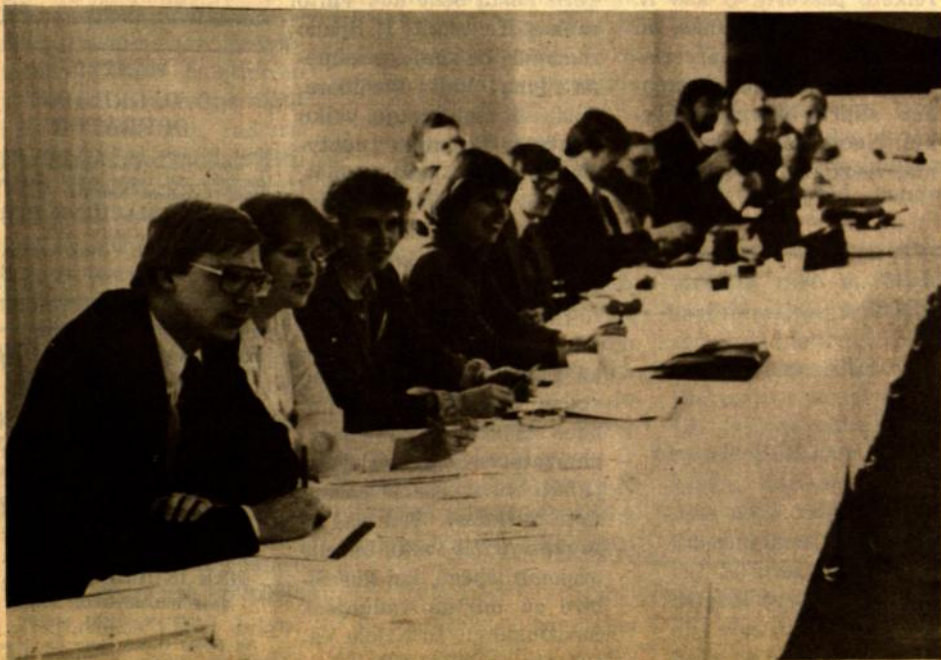
Dalis konferencijos dalyvių.