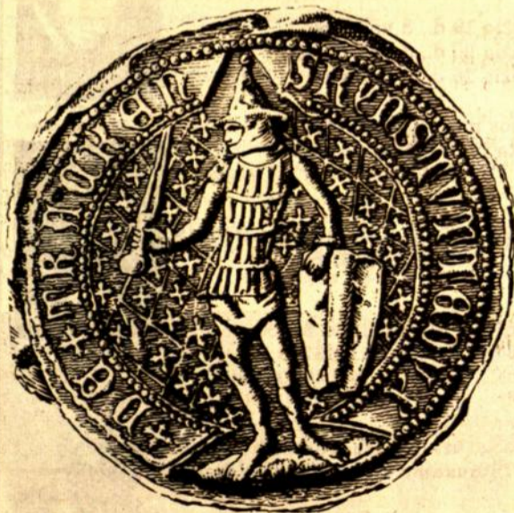
Kęstučio antspaudas 1379 m.