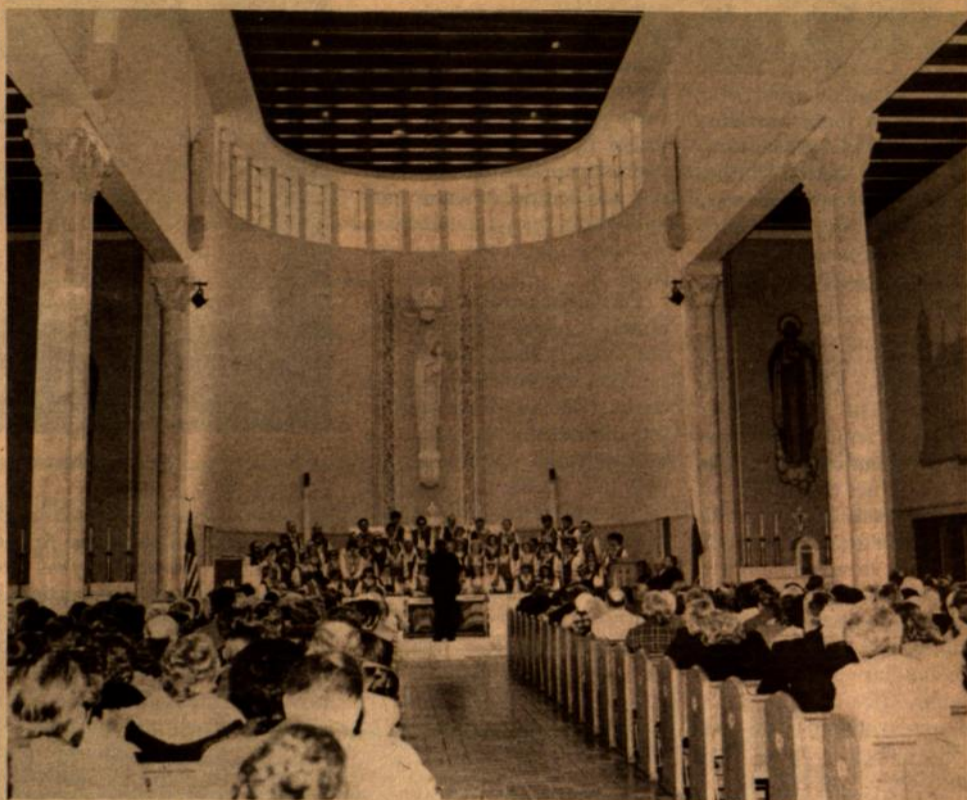
Čiurlionio ansamblis gieda Dievo Motinos parapijos bažnyčioje religinio koncerto metu.