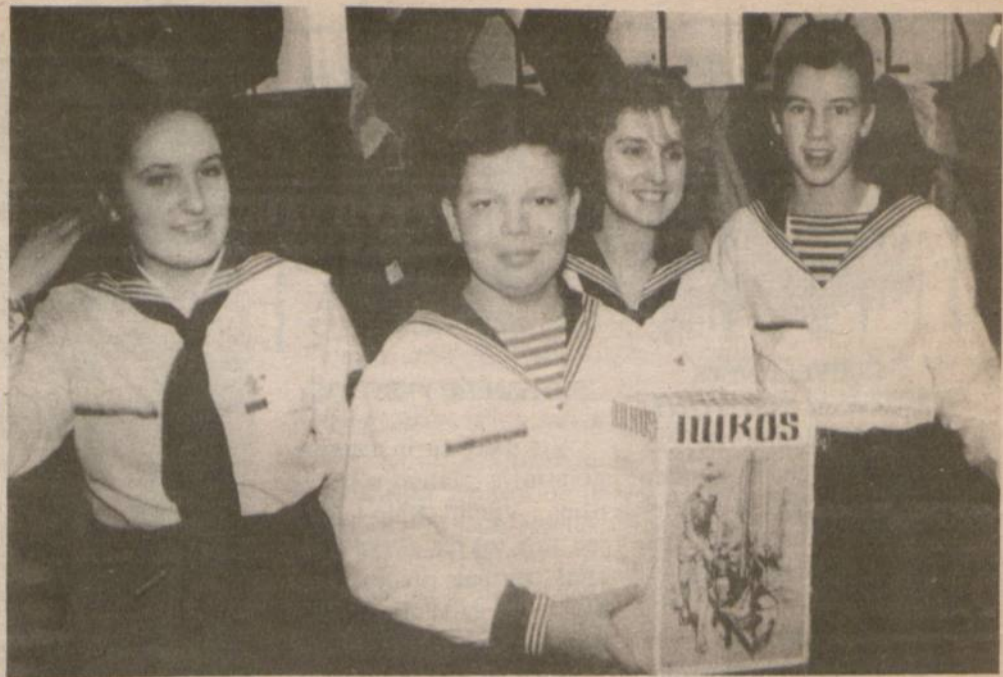
Lietuvos jaunieji jūros skautai, kurie rinko aukas III Lietuvos Sąjūdžio suvažiavimo Vilniuje

Konkurso laimėtojas vieną koncertą turės New Yorke, o kitus – įvairiose JAV vietose.