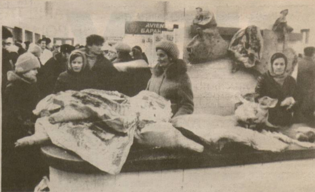
Vilniaus Kalvarijų turguje mėsos yra nemaža, tačiau gruodžio viduryje kilogramas kiaulienos kainavo 50-70 rublių.