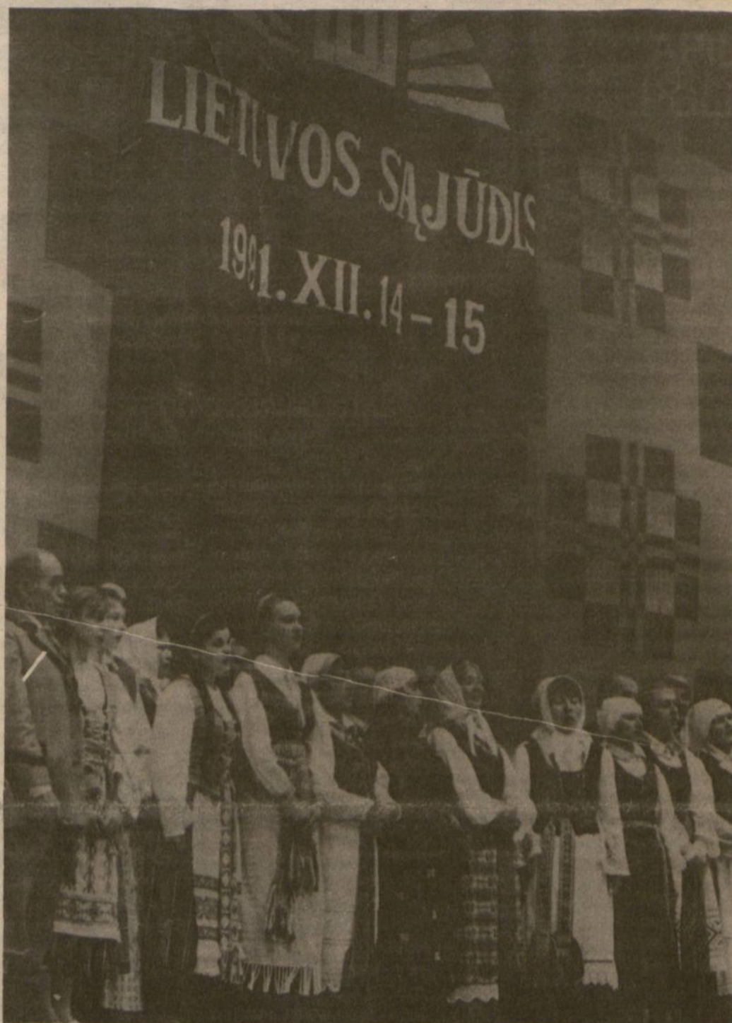
Lietuvos Sąjūdžio meninės dalies atlikėjai