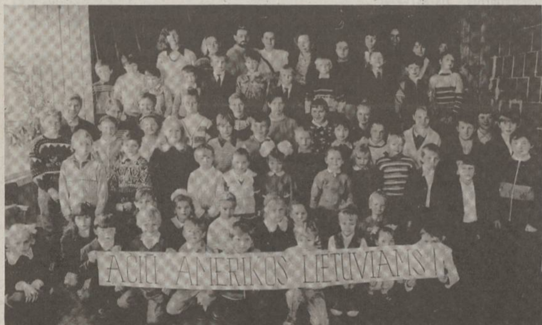
Vilniaus rajono Bezdonių mokyklos mokiniai ir mokytojai.

Su pagarba Jums "Dirvos" skaitytojas A. Bliudakis