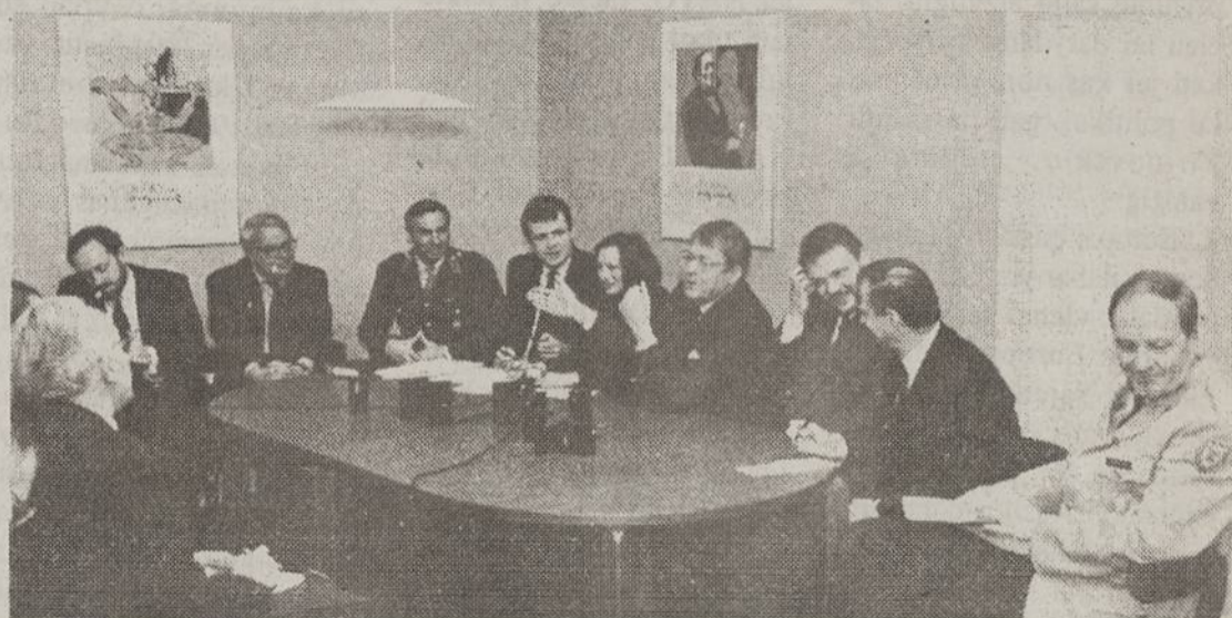
Nuo partnerystės link narystės. NATO ekspertų Lietuvoje spaudos konferencija.