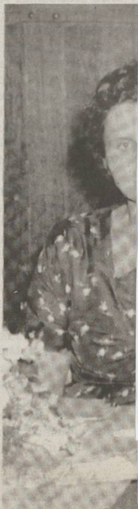
Prof. dr. Marija Gimbutienė