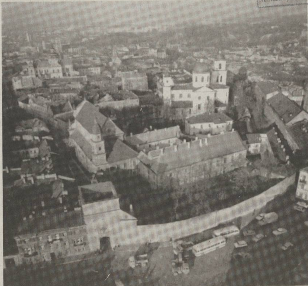
Lietuvos sostinė Vilnius. Dalis senamiesčio iš paukščio skrydžio. Priekyje jėjimas į Aušros Vartus ir gynybinės sienos likučiai.