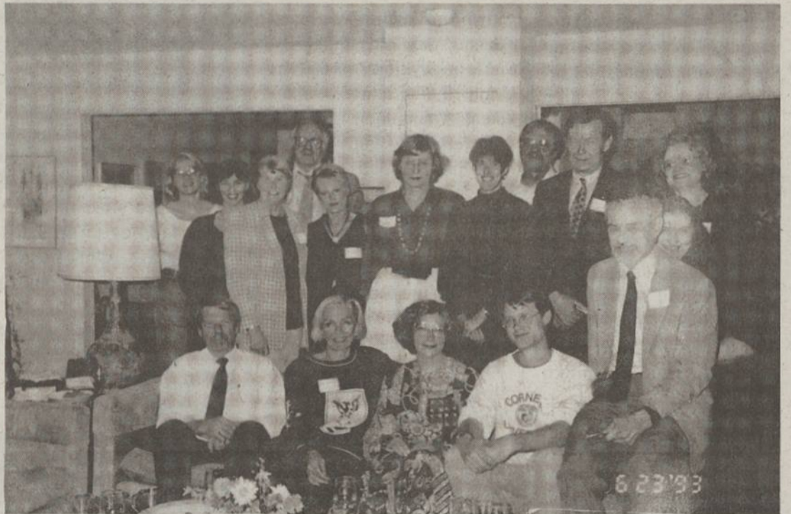
Washingtono Universitete, esančiam Seattle, Wash., šią vasarą veiks Baltic Studies vasaros semestras. Jis tęsis nuo birželio 20 iki rugpjūčio 19d. Mokslas vyks kasdien, per savaitę iš viso po 20 valandų.

Jei nebūtų mūsų tėvai, Jūs ir Jūsų draugai ir bendraamžiai įsteigę tiek organizacijų ir mokyklų, šandien nebūtų tokių žmonių kaip mūsų kolegos Lendrai-